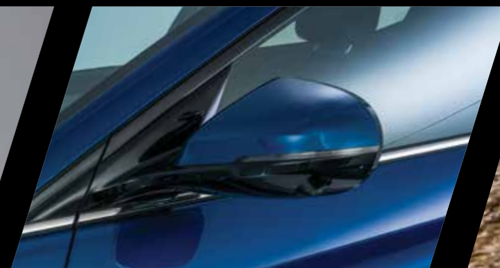
מראות צד מתקפלות חשמלית