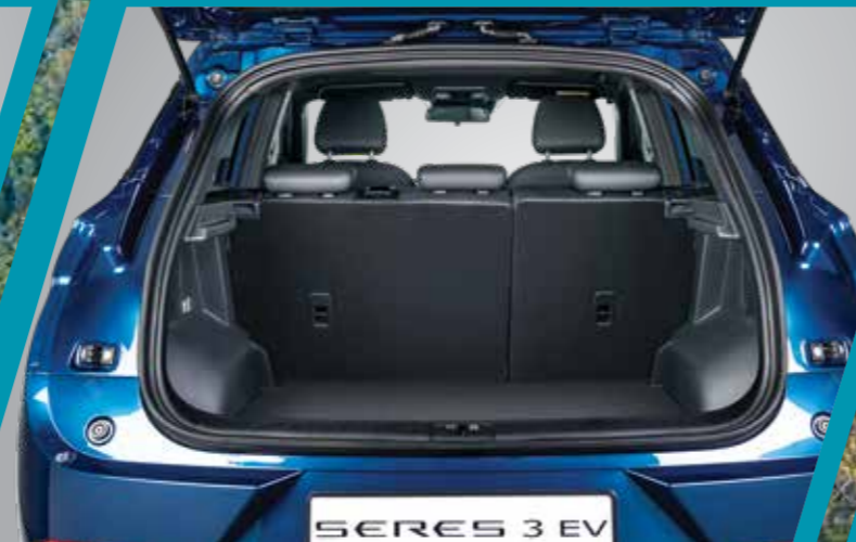
גמישות פנימית החלל הפנימי של SERES 3 גמיש מספיק כדי לתמוך בסגנון חיים פעיל ודינאמי. מושב אחורי מפוצל ומתקפל ביחס 60:40