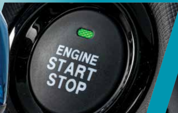
"מפתח חכם" לכניסה והנעה ללא מפתח