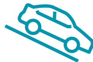
HDC - מערכת בקרת ירידה במדרון