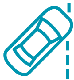
LDWS - מערכת התראה סטייה מנתיב