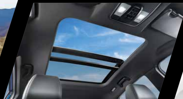
חלון גג פנורמי נפתח עם וילון חשמלי