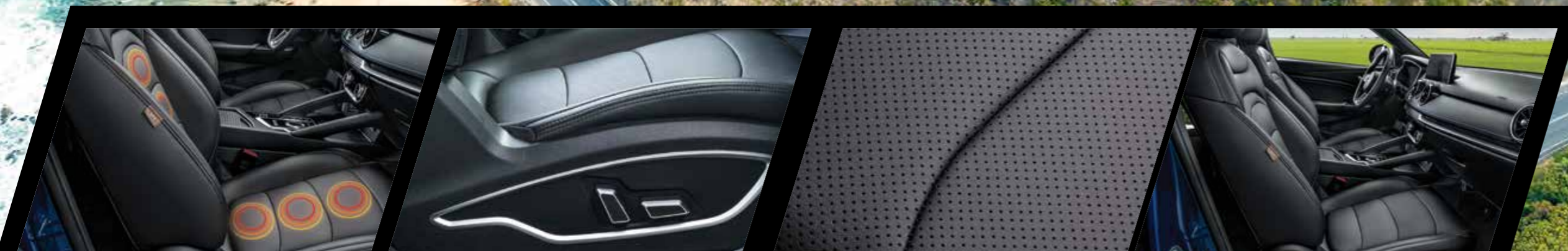
מושבים קידמיים עם כוונן חשמלי וחימום

הודות למידות הפנים הנדיבות, גם לך וגם לנוסעים מובטחת נסיעה נינוחה, שפע של מקום ודרכים חכמות לנצל אותו. המושב האחורי רב-תכליתי מתקפל ביחס של 60:40 וגם למצב שטוח, ומאפשר להגדיל את מרחב האחסון העומד לרשותך.