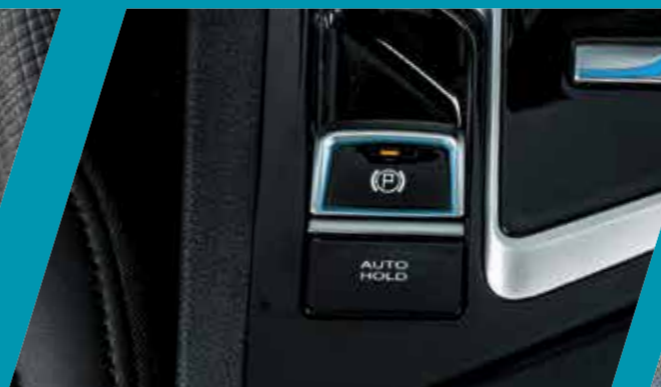
בלם חניה חשמלי