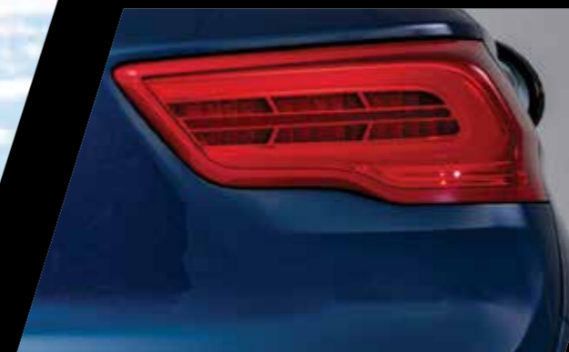
יחידת תאורה אחורית LED