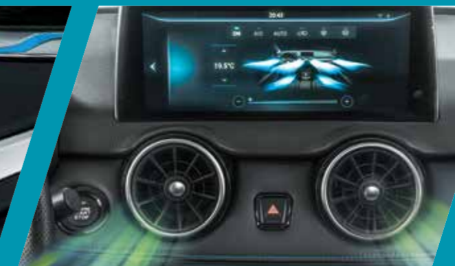
מערכת בקרת אקלים ופתחי מיזוג למושבים אחוריים