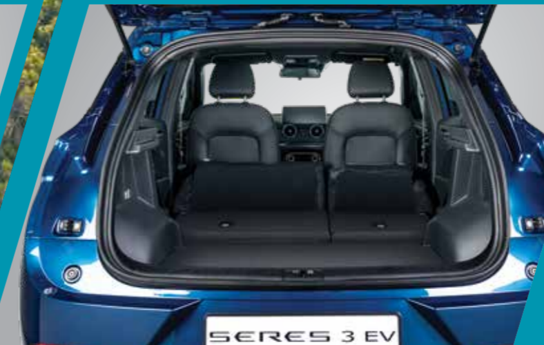
מושב אחורי מתקפל גב המושב האחורי מתקפל למצב שטוח לקבלת נפח מטען וגמישות מרביים.

הודות למידות הפנים הנדיבות, גם לך וגם לנוסעים מובטחת נסיעה נינוחה, שפע של מקום ודרכים חכמות לנצל אותו. המושב האחורי רב-תכליתי מתקפל ביחס של 60:40 וגם למצב שטוח, ומאפשר להגדיל את מרחב האחסון העומד לרשותך.