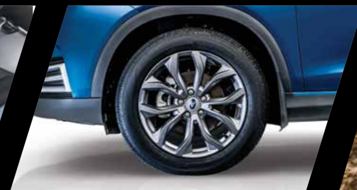
חישוקי אלומיניום בגודל 18"