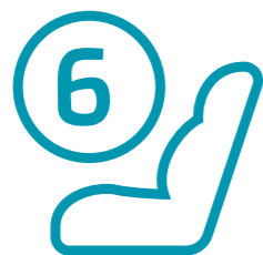
6 כריות אוויר - ההגנה כוללת כריות אוויר קדמיות לנהג ולנוסע הקדמי, שתי כריות אוויר צדיות ושתי כריות וילון הנפרשות לכל אורך תא הנוסעים