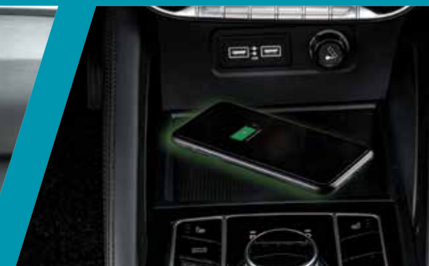
משטח טעינה אלחוטי לטלפון