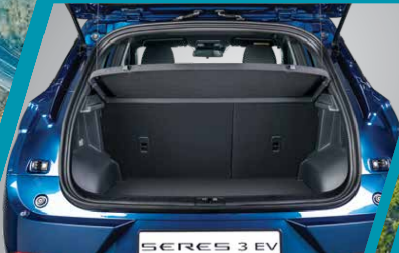
כיסוי לאזור המטען