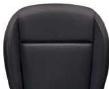
ריפודי בד - שחור