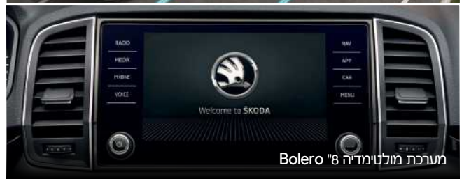
מערכת מולטימדיה "8 Bolero