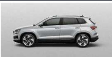
BRILLIANT SILVER (8E)