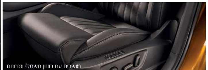
מושבים עם כוונן חשמלי וזכרונות