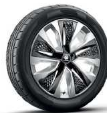
חישוקי סגסוגת PROCYON "18"