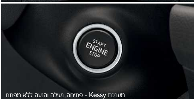
מערכת Kessy - פתיחה, נעילה והנעה ללא מפתח