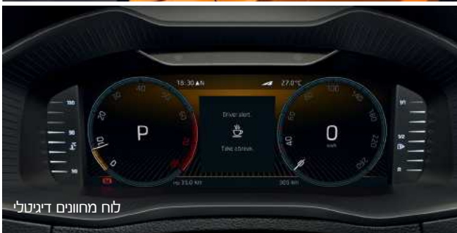
לוח מחוונים דיגיטלי