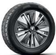
חישוקי סגסוגת "17 SCUTUS