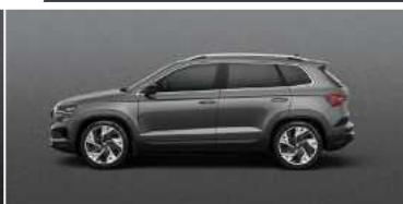
GRAPHITE GREY (5X)