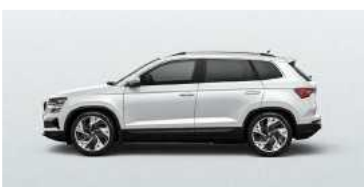
MOON WHITE (2Y)