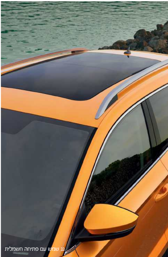
גג שמש עם פתיחה חשמלית