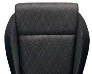
ריפודי בד - שחור