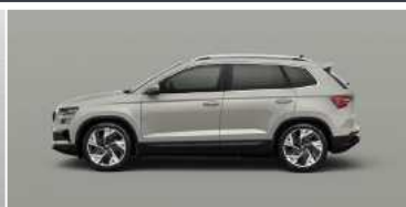
STEEL GREY (M3)