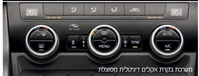
מערכת בקרת אקלים דיגיטלית מפוצלת