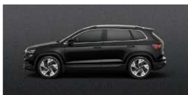
MAGIC BLACK (1Z)