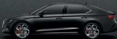
Magic Black metallic