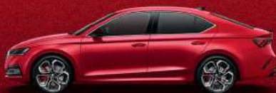
Velvet Red metallic