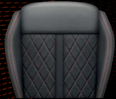
מושבי ספורט ארגונומיים עם ריפודי אלקנטרה / עור + מסאז'*