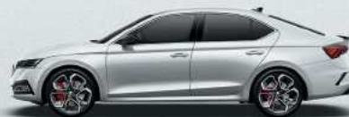
Moon White metallic