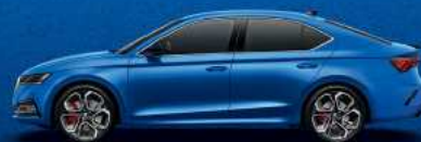
Race Blue metallic