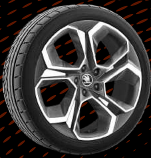
חישוקי סגסוגת RS בגודל 19"