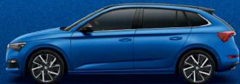
RACE BLUE METALLIC

* ייתכן הבדל בין גוון הצבע הנראה במפרט לבין הגוון בפועל