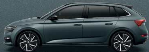
QUARTZ GREY METALLIC