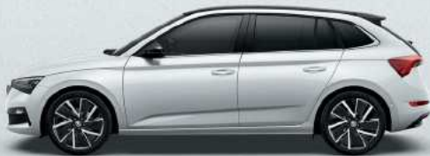
MOON WHITE METALLIC