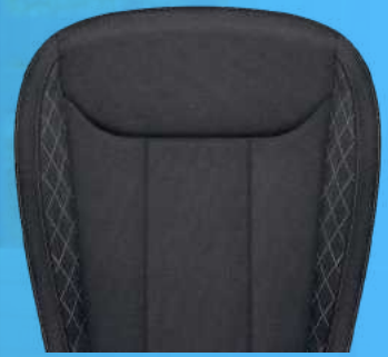
התמונות להמחשה בלבד