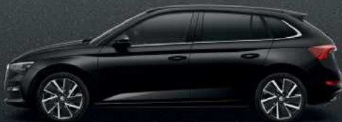
MAGIC BLACK METALLIC