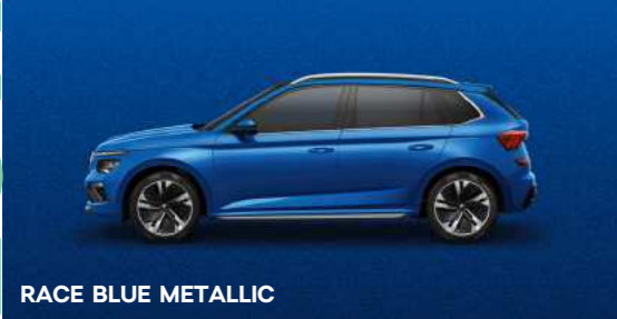
RACE BLUE METALLIC