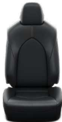
עור שחור ריפוד עור בצבע שחור, מגיע ברכבים עם צבע חיצוני לבן צחור וכסוף יוקרתי.