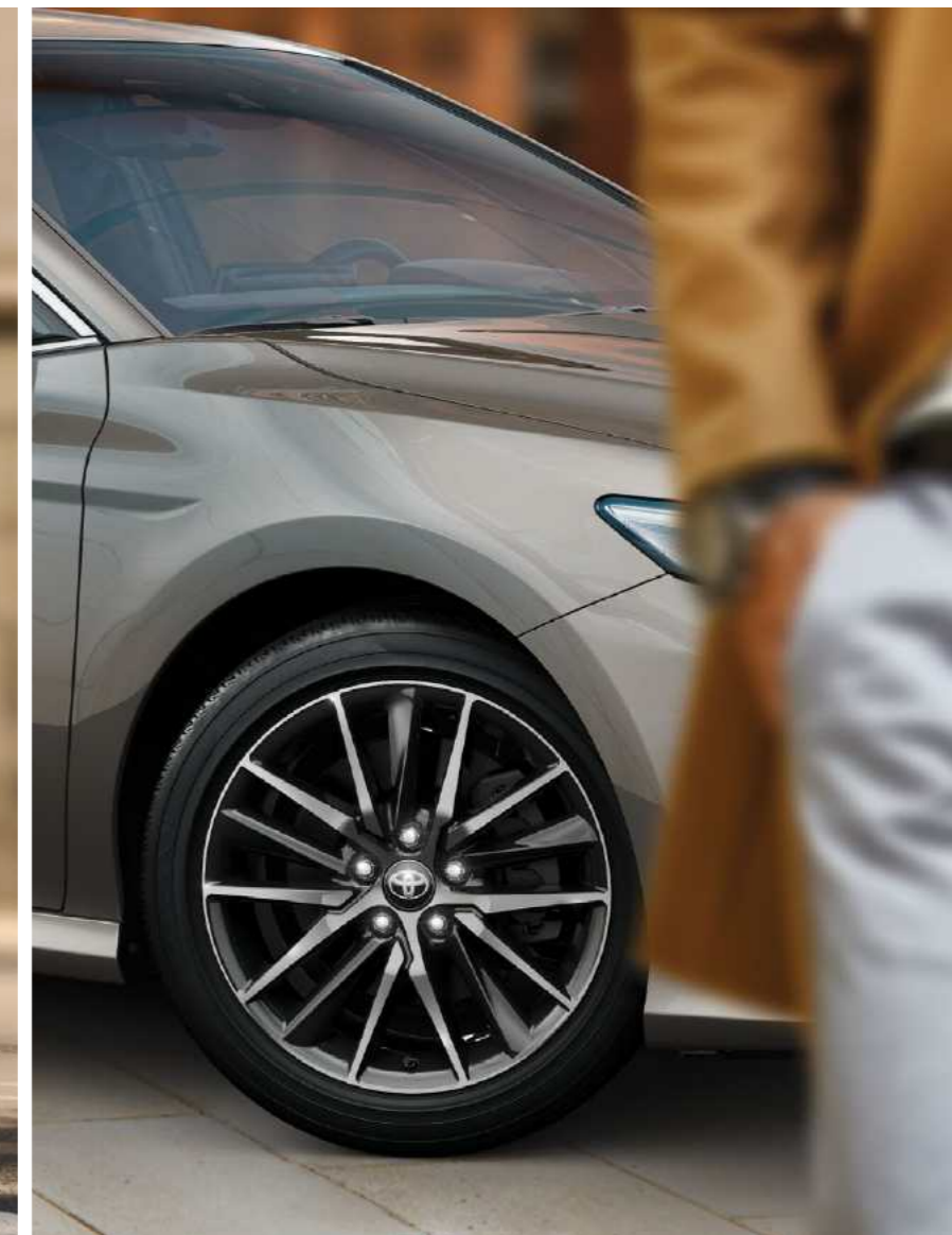
חישוקי סגסוגת קלה 18" המספקים לקאמרי מראה חד ודינמי