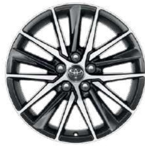
חישוקי סגסוגת קלה 18".