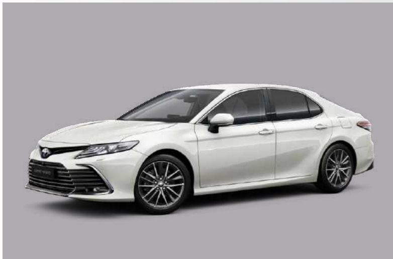
לבן פנינה מטאלי B-089