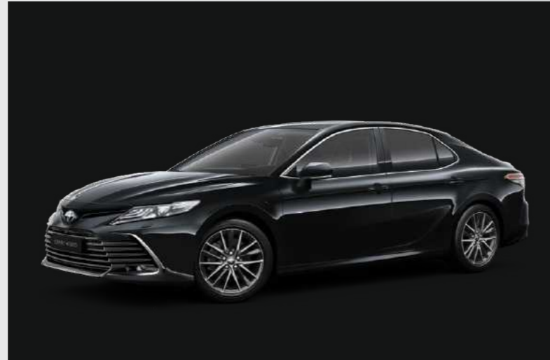
שחור מיקה מטאלי B-218