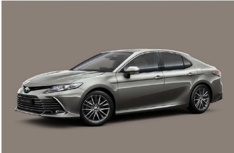
כסוף כהה יוקרתי B-1L5