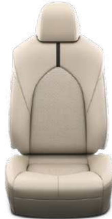
עור בהיר ריפוד עור בצבע בז', מגיע ברכבים עם צבע חיצוני לבן פנינה, שחור.