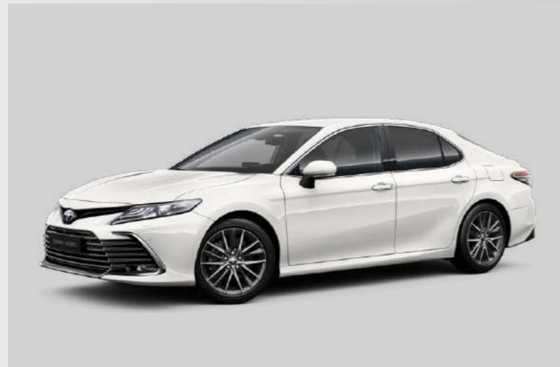
לבן צחור B-040