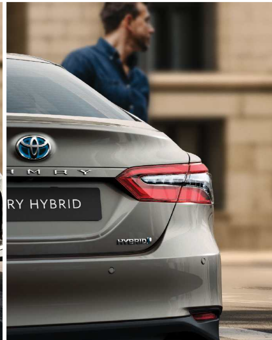
פנסי לד אחוריים שמושכים את העין, במראה עדכני ויוקרתי יותר