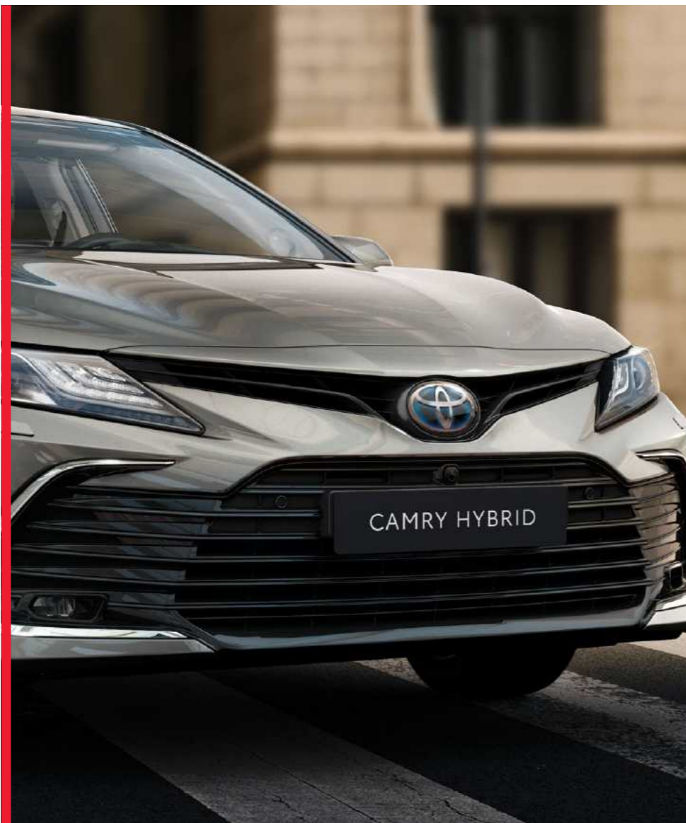
גריל חדש עם חרטום נמוך, רחב ונועז יותר המדגיש את נוכחותה המרשימה והנחושה של הקאמרי החדשה

בקאמרי ההיברידי-חשמלית החדשה יש הכל. היא משלבת בצורה מושלמת את היתרונות של מכונית מנהלים איכותית ועיצוב חדש, מרענן ויוקרתי יותר של חזית הרכב ותא הנוסעים. דבר המוסיף ליכולתה הדינמית של הקאמרי, ומשווה לה נוכחות בולטת וחזקה בכביש. התוצאה: מכונית שגם נראית מצוין, גם נוחה ומרווחת וגם מספקת חווית נהיגה ברמה של מחלקה ראשונה.