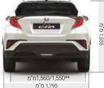
מ"מ 1,560/1,550** מ"מ 1,795