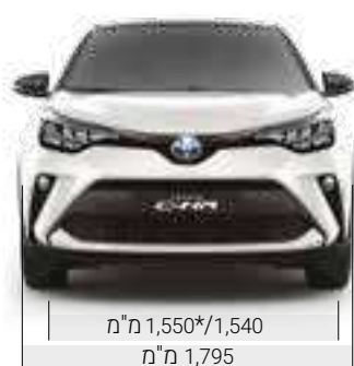
מ"מ 1,550*/1,540 מ"מ 1,795