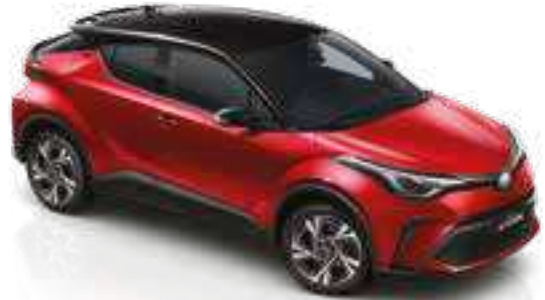
2TB - אדום עז (3U5) / שחור (202)