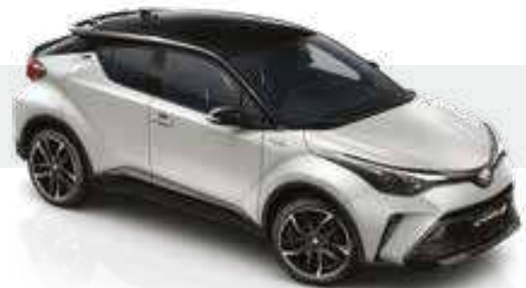
2VF - לבן דינמי (1A6) / שחור (202)