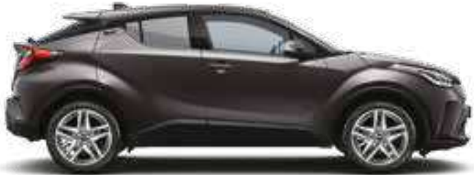
אפור גרניט מטאלי 1G3