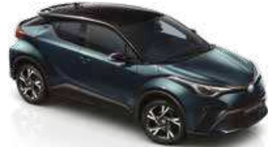
2YB - כחול טורקיז מטאלי (785) / שחור (202)