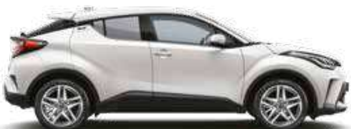
לבן צחור 040