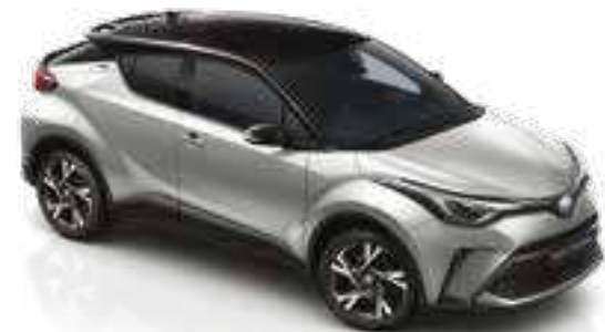
2VU - כסוף מטאלי (1L0) / שחור (202)