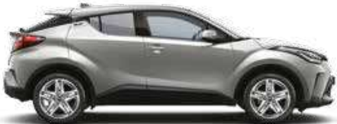
כסוף מטאלי 1L0