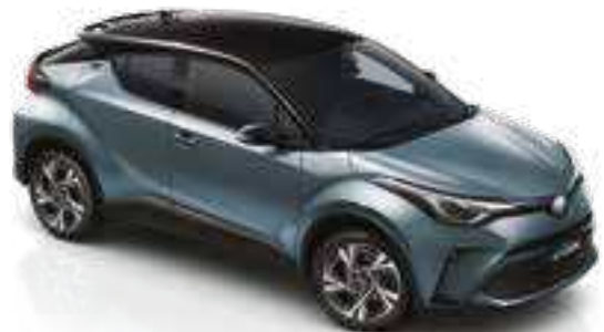
2TH - אפור תכלת (1A3) / שחור (202)