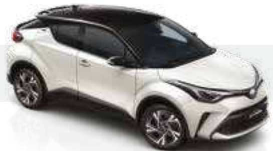
2VP - לבן פנינה (089) / שחור (202)