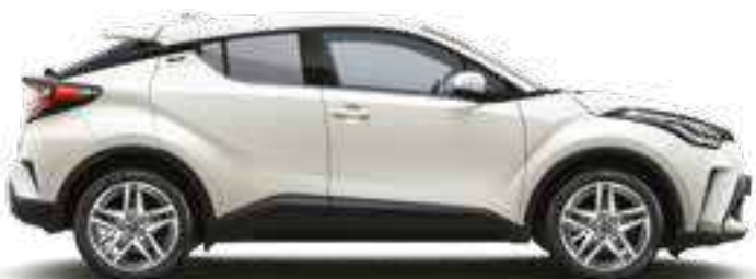
לבן פנינה מטאלי 089