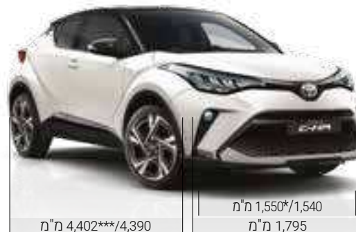
מ"מ 4,402**/4,390 מ"מ 1,550*/1,540 מ"מ 1,795

*מתייחס לדגם C-ITY. **מתייחס לדגם C-HIC. ***מתייחס לדגם GR SPORT