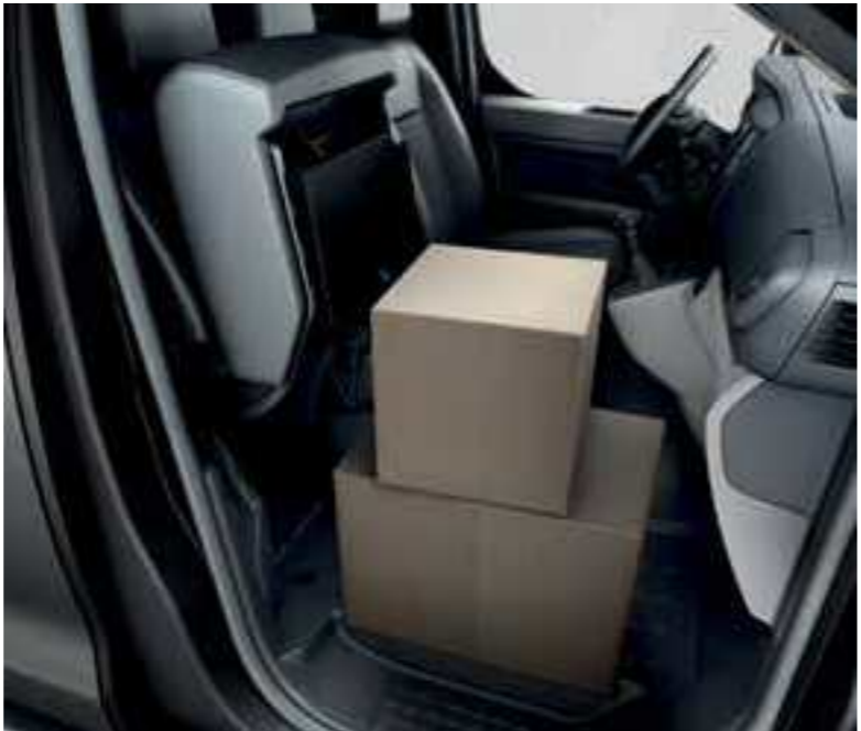
מנצלים את המרחב בצורה מיטבית עם מושב קדמי מתקפל