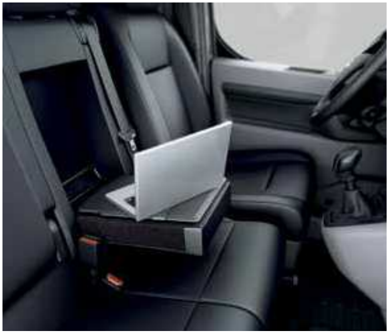
מסתכלים על התמונה הגדולה עם מושב שמתקפל והופך למשרד נייד ביום יום