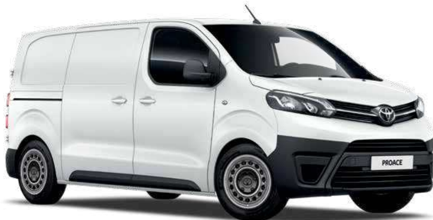
לבן אייס EWP