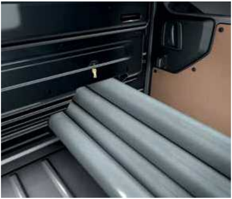
החלל המרווח והפונקציונלי של הרכב מאפשר לך להוביל חפצים ארוכים יותר