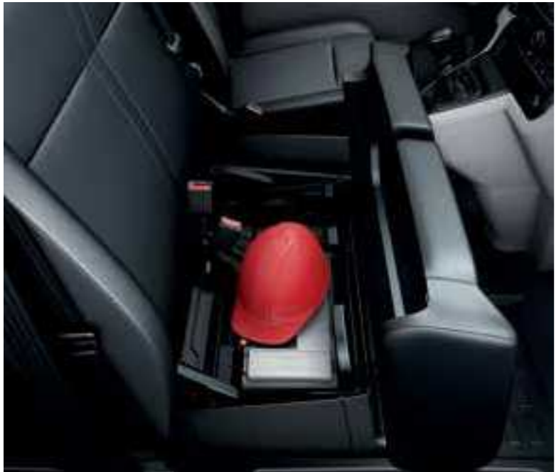
דואגים להשאיר את הדברים החשובים קרובים אליכם עם תא אחסון מיוחד מתחת למושב הנוסע הקדמי התמונות להמחשה בלבד.