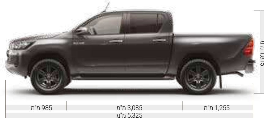
1,815 מ"מ 985 מ"מ | 3,085 מ"מ | 1,255 מ"מ 5,325 מ"מ