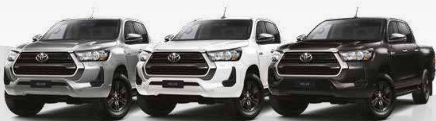
כסוף מטאלי 1D6