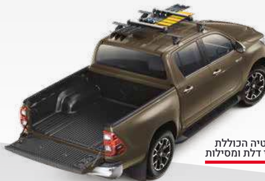
אמבטיה הכוללת ניסוי דלת ומסילות