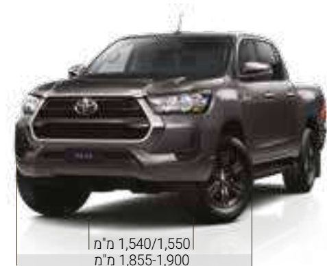
1,540/1,550 מ"מ 1,855-1,900 מ"מ