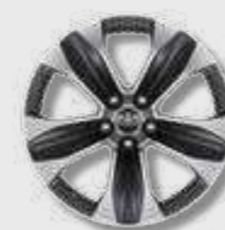
חישובי סגסוגת קלה 18" בדגם E-MOTION 4X4