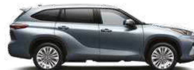
1A5 כחול טיטניום מטאלי*