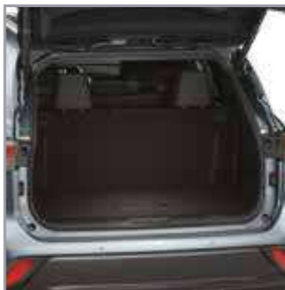
שטיח לבד לתא מטען

שטיח לבד לתא המטען המגן מפני לכלוך ומוסיף למראה האלגנטי של הרכב