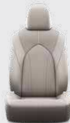
ריפוד עור בצבע אפור E-XCLUSIVE 4X4