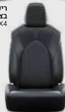
ריפוד עור בצבע שחור E-XCLUSIVE 4X4