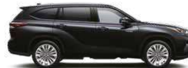
218 שחור מיקה מטאלי