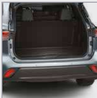
אמבטיה לתא מטען

שטיח גומי לתא מטען המספק הגנה מפני לכלוך והחלקה של ציוד וסחורה