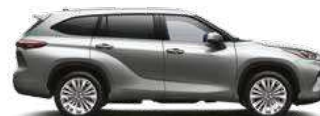
1J9 כסוף מטאלי