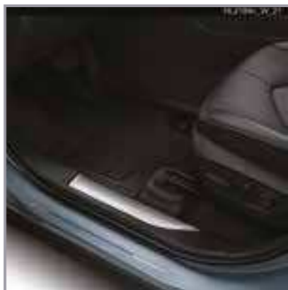
סט שטיחי גומי

שטיחי הגומי מגנים על פנים הרכב מפני לכלוך מבחוץ וניתנים להסרה לניקוי קל ופשוט