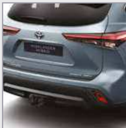
וו גרירה מקורי קבוע כולל התאמת הפגוש האחורי

וו גרירה מקורי המספק כושר גרירה גבוה המאפשר התקנה של מתקן אופניים אחורי