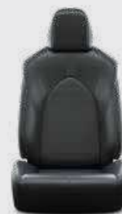
ריפוד דמוי עור בצבע שחור E-MOTION 4X4