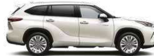
089 לבן פנינה מטאלי