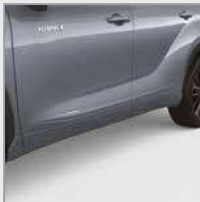
פסי הגנה לדלתות

סט פסי הגנה לדלתות בצבע הרכב המספקים שכבת הגנה לדלתות מפני שריטות ופגיעות