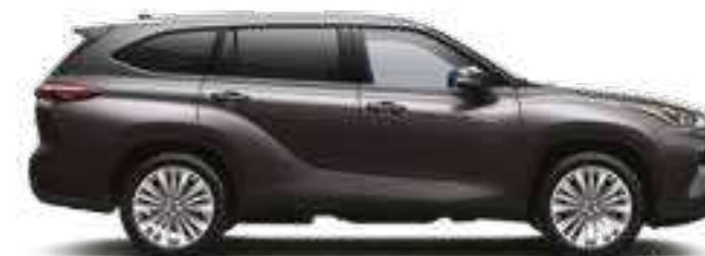
163 אפור כהה מטאלי