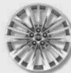
חישובי סגסוגת קלה 20" בדגם E-XCLUSIVE 4X4