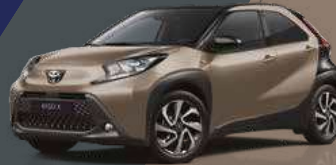
בז' ג'ינג'ר / שחור 4U9/209 - 2VJ