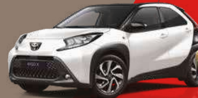
לבן צחור / גג שחור 040/209 - 2NR