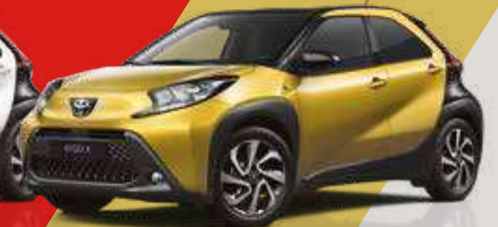
זהב / שחור 5C2/209 - 2TY