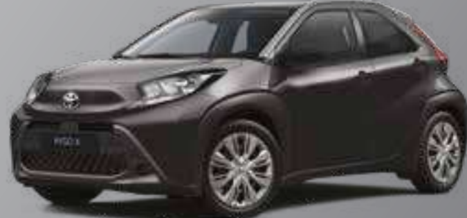
שחור מטאלי 209