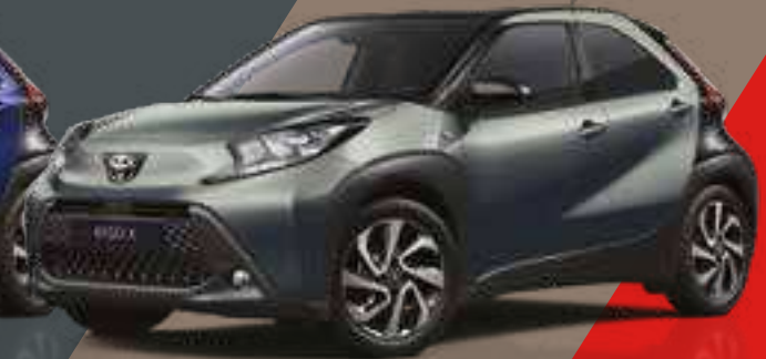
ירוק הל / שחור 6W4/209 - 2VK