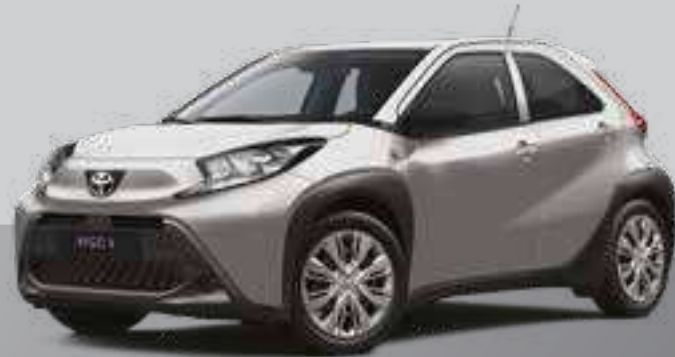
כסף מטאלי 1L0