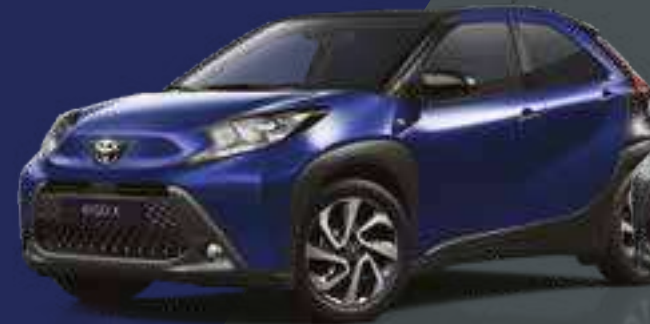
כחול ג'וניפר / שחור 8Y8/209 - 2VL