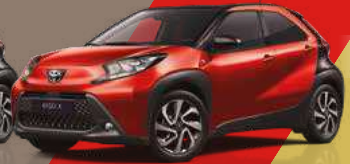
אדום צ'ילי / שחור 3U4/209 - 2VH