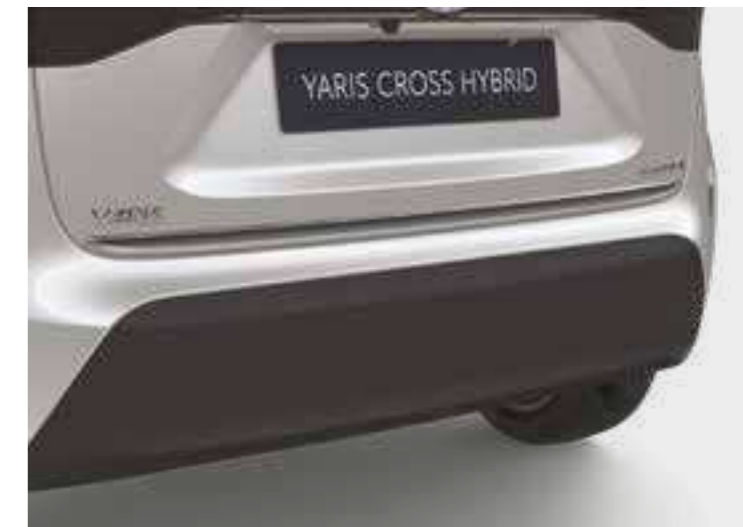
הוסיפו קישוט כרום המדגיש את עיצוב הפגוש האחורי ומבליט את המראה הייחודי של הרכב