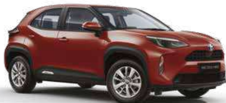
אדום מטאלי 3U5