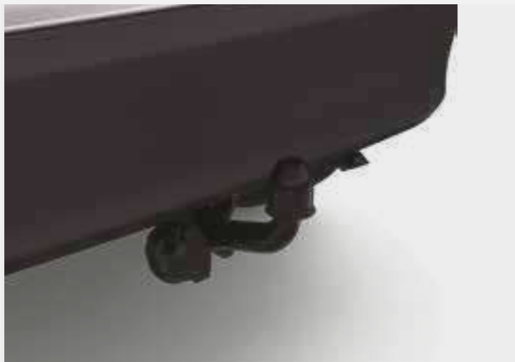
וו גרירה קבוע*