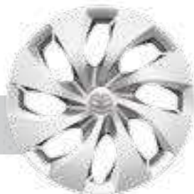
חישוקי פלדה 16"