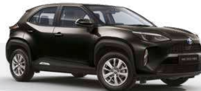
שחור מטאלי 209