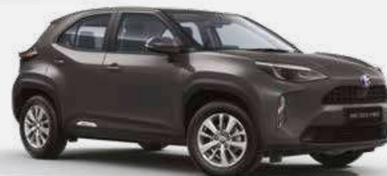
אפור כהה מטאלי 1G3