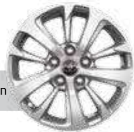
חישוקי סגסוגת קלה 16"