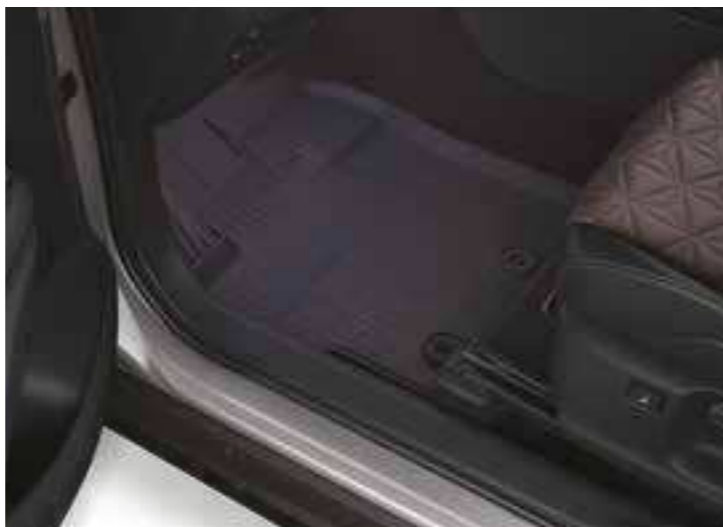
שטיחי גומי המגנים על פנים הרכב מפני לכלוך מבחוץ וניתנים להסרה לניקוי קל ופשוט