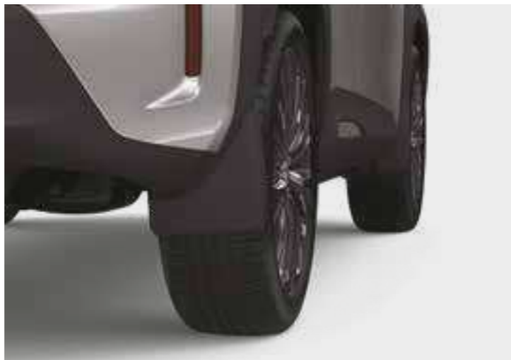
סט מגיני בוץ קדמיים ואחוריים, שיעזרו למזער כתמי מים ובוץ על הרכב