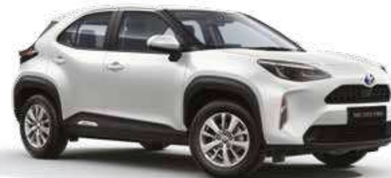
לבן צחור 040