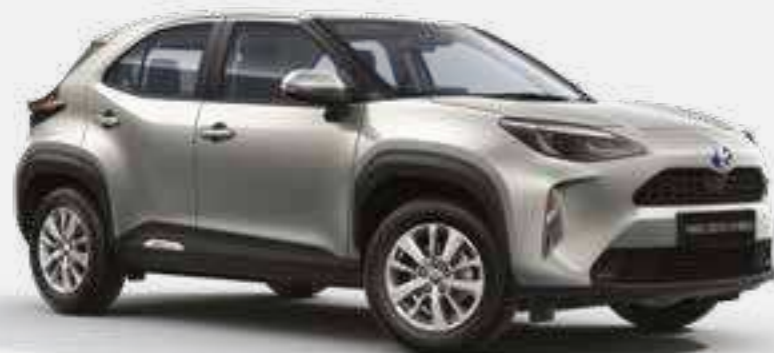
כסוף מטאלי 1L0