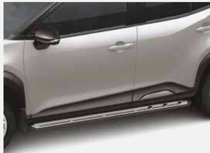
מדרגות צד המעצימות את המראה המחוספס של הרכב. שבנוסף מסייעות להגיע לגג הרכב בצורה קלה ופשוטה יותר