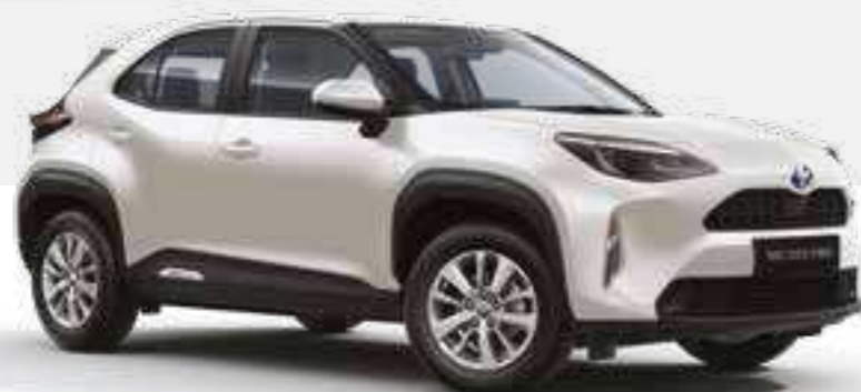
לבן פנינה מטאלי 089