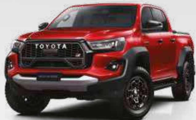
אדום טז 3U5**