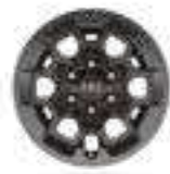
חישוקי סגסוגת קלה 17" בצבע שחור דגם GR SPORT

*נדלקת עם התנעת הרכב כל עוד פנסי הרכב אינם דולקים ● קיים ○ לא קיים