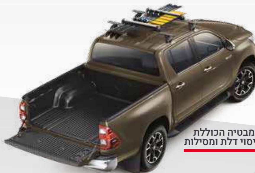
אמבטיה הכוללת כיסוי דלת ומסילות

אמבטיה לתא המטען, וו גרירה, קשת דקורטיבית ובולם שיכוך לדלת האחורית