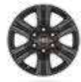
חישוקי סגסוגת קלה 17" בצבע שחור דגמי ACTIVE+, ADVENTURE