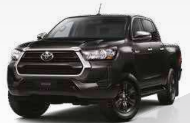
שחור מיקה מטאלי *218