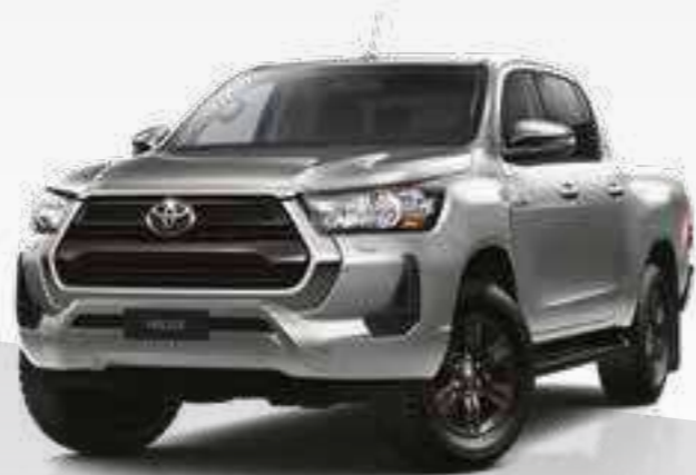
כסוף מטאלי 1D6