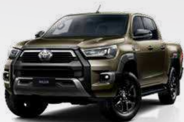
ברונזה מוזהב מטאלי 1X6*