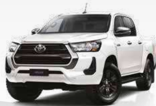
לבן צחור 040