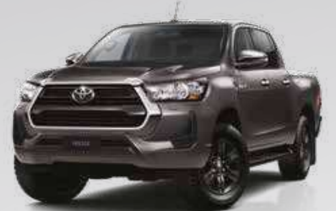
אפור כהה מטאלי 1G3