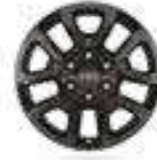
חישוקי סגסוגת קלה 18" בצבע שחור דגם SAHARA