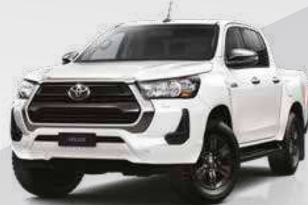
לבן פיניה מטאלי 089