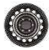
חישוקי פלדה 17" דגמי ACTIVE