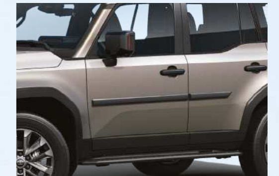
פסי הגנה לדלתות מספקים שכבת הגנה נוספת, שמגנה על צדי הרכב מפני מכות קלות ושפשופים, מגיעים בעיצוב אלגנטי