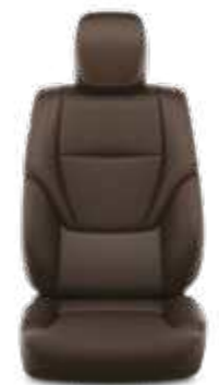
ריפוד עור בצבע אדמה זמין ברמות גימור SAHARA SKY MHEV (כתלות בצבע חיצוני)