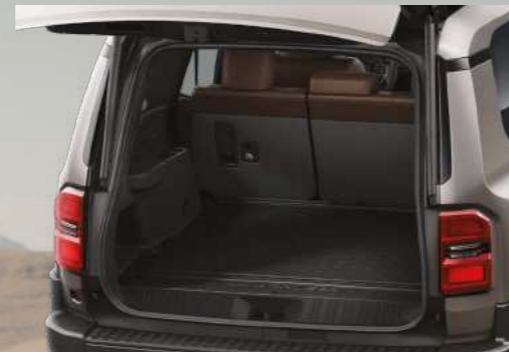
משטח הגנה לתא מטען