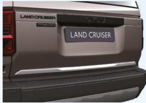
קישוט כרום לדלת תא מטען מגע של יוקרה וייחודיות לאורך הקצה התחתון של דלת תא המטען של המכונית שלך