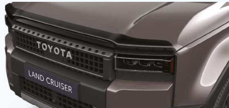
מסית רוח למכסה המנוע הפתרון האידיאלי להפחתת רעשי רוח ולשיפור היעילות האווירודינמית של הרכב בעיצוב ספורטיבי אלגנטי וכמובן עשוי מחומרים עמידים