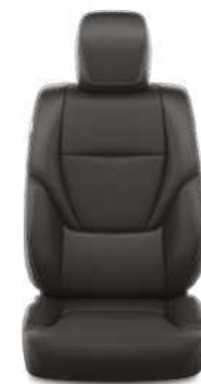
ריפוד עור מלאכותי בצבע שחור זמין ברמות גימור LUXURY/LUXURY 5, LIMITED, LIMITED SKY