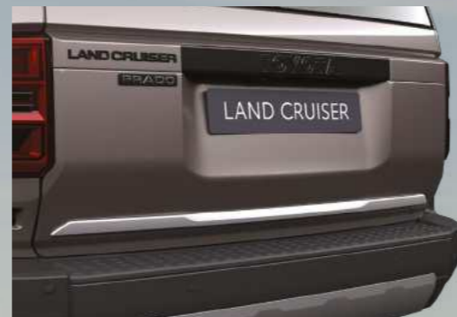
קישוט כרום לדלת תא מטען