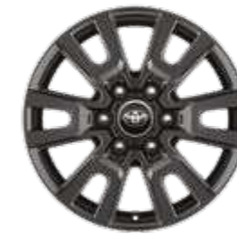
חישוקי סגסוגת קלה 18" זמין ברמת גימור LUXURY MHEV