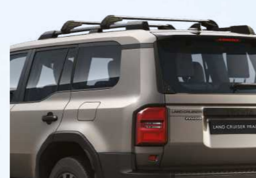
מוטות רוחב הפתרון המושלם להרחבת אפשרויות ההובלה. מוטות הרוחב מותאמים במיוחד למוטות האורך המתקנים ברכבך, יחד הם יוצרים בסיס בטוח לנשיאת מטען. המוטות ניתנים לפירוק והרכבה מהירים ובעלי יכולת העמסה של עד 100 ק"ג