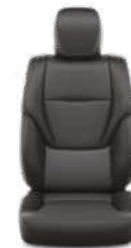
ריפוד עור בצבע שחור זמין ברמת גימור SAHARA SKY MHEV (כתלות בצבע חיצוני)