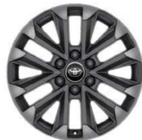
חישוקי סגסוגת קלה 20" זמין ברמת גימור SAHARA, SAHARA SKY