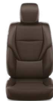
ריפוד עור מלאכותי בצבע אדמה זמין ברמות גימור LIMITED, LIMITED SKY