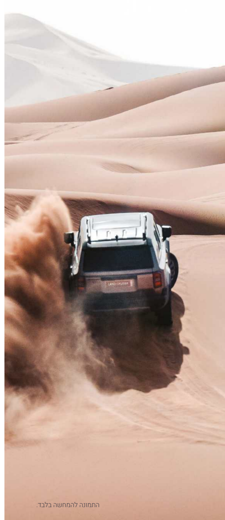
התמונה להמחשה בלבד.