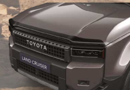
מסיט רוח - מכסה מנוע