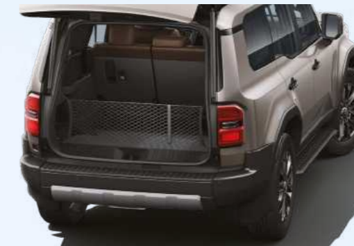
רשת אנכית לתא המטען שמירה על סדר ובטיחות בזמן הנסיעה. מונעת תזוזת חפצים, עשויה מחומרים עמידים וגמישים, ומותאמת באופן מושלם לתא המטען של הרכב