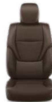
ריפוד עור מלאכותי בצבע אדמה זמין ברמת גימור LIMITED SKY MHEV