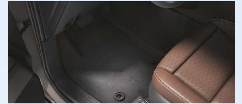
שטיחי גומי הגנה מרבית מפני לכלוך ונוזלים, עמידים וקלים לניקוי. מותאמים בדיוק למבנה הרכב ושומרים על רצפת הרכב נקייה בכל תנאי מזג האוויר