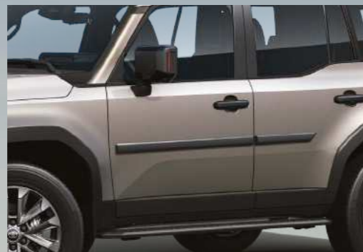
פסי הגנה לדלתות