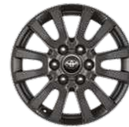
חישוקי סגסוגת קלה 18" זמין ברמת גימור SELECT MHEV