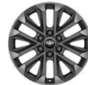
חישוקי סגסוגת קלה 20" זמין ברמת גימור SAHARA SKY MHEV