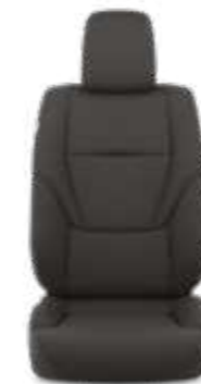
ריפוד בד בצבע שחור זמין ברמת גימור SELECT MHEV