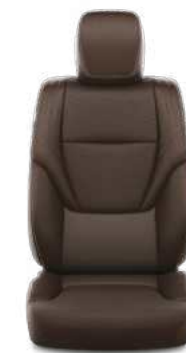
ריפוד עור בצבע אדמה זמין ברמות גימור SAHARA, SAHARA SKY (כתלות בצבע חיצוני) FIRST EDITION