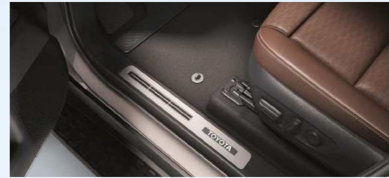
פס קישוט סף דלת מואר הפס המואר מייצר מראה מודרני ומרהיב, עם תאורה שמאירה את אזור הכניסה לרכב בחשכה. עשוי מחומרים איכותיים ומשדרג את חוויית הנסיעה