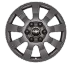
חישוקי סגסוגת קלה 18" זמין ברמת גימור LIMITED SKY MHEV