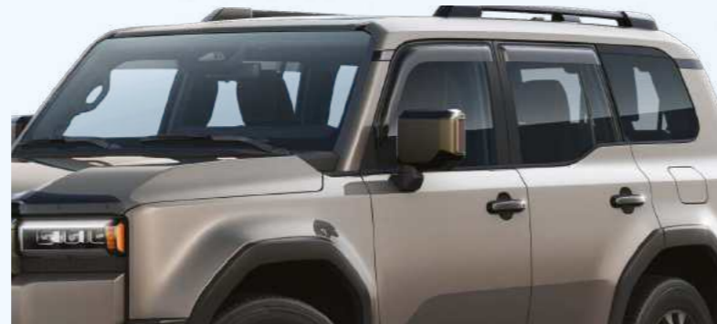
מגיני רוח פתרון מושלם לנסיעות נוחות ללא רעשי רוח ובאווירה רגועה, עשויים מחומרים עמידים, ומותאמים בצורה מושלמת לרכב