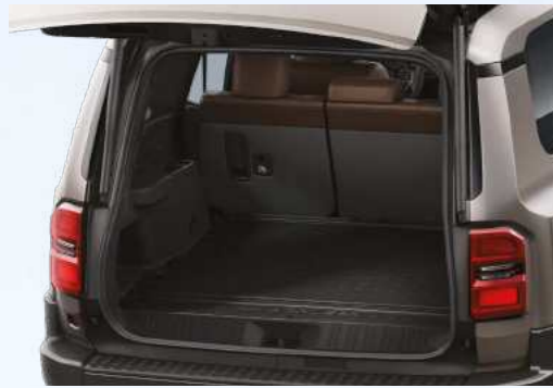
משטח הגנה לתא המטען שמור על תא המטען שלך נקי ומוגן מפני לכלוך, נוזלים ושריטות. עמיד, קל לניקוי, ומותאם בצורה מושלמת