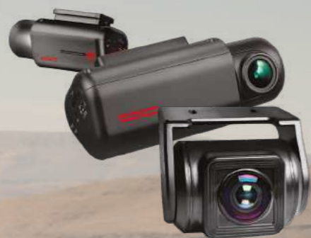
מצלמת DVR מצלמת דרך קדמית ואחורית מתעדת כל אירוע בכביש