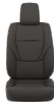
ריפוד בד בצבע שחור זמין ברמת גימור SELECT