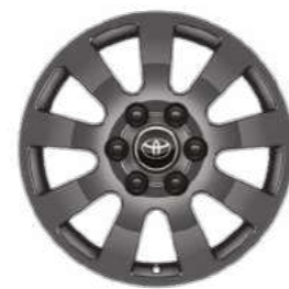
חישוקי סגסוגת קלה 18" זמין ברמות גימור LIMITED, LIMITED SKY, FIRST EDITION