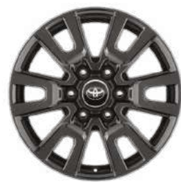
חישוקי סגסוגת קלה 18" זמין ברמת גימור LUXURY/LUXURY 5