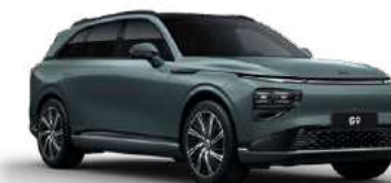
Kaitoke Green Matte זמין בגרסת Performance בלבד