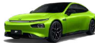
Floating Green *זמין בגרסת Wing Edition