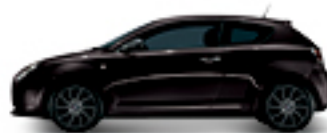
805 שחור אמנה