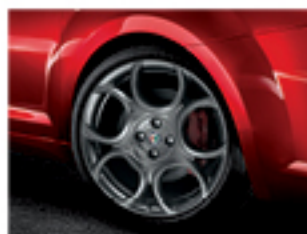
73Z חישוקי '18