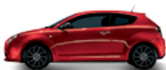
289 אדום קופירדן