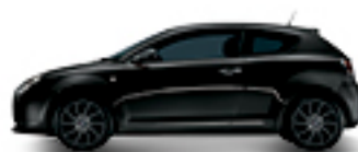
601 שחור אלנטי