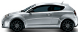
612 כסף סטאלי