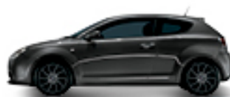
607 אפור ברפיטי