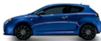
468 כחול טורנדו