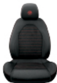
בד מטולב אלקנטרה