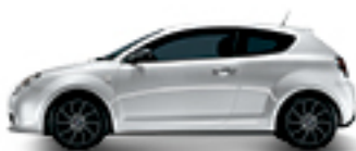
268 לבן אלפא