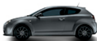
529 אפור מונציום סט