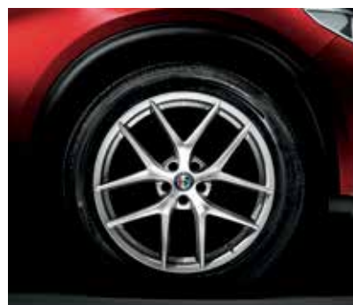
5A6 - 20" FIRST EDITION