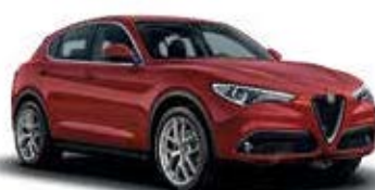
414 אדום אלפא