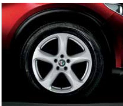
4AY - 18" MILANO