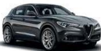
035 אפור מטאליקו