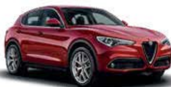
361 אדום 8C