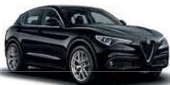
048 שחור וולקנו