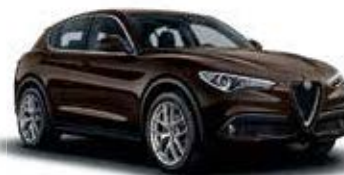
480 חום אטנה