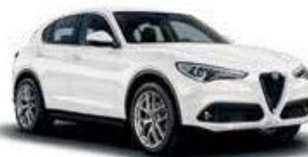
217 לבן אלפא