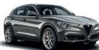
318 אפור מנגזיום