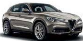
082 בז' טיטניום