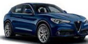
092 כחול מונטה קרלו