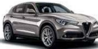
620 כסף סילברסטון