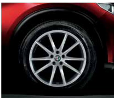
5FB - 19" MILANO SPECIALE