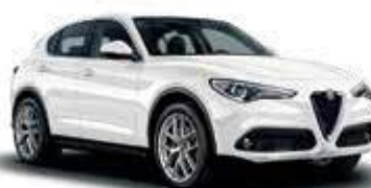
248 לבן טריו