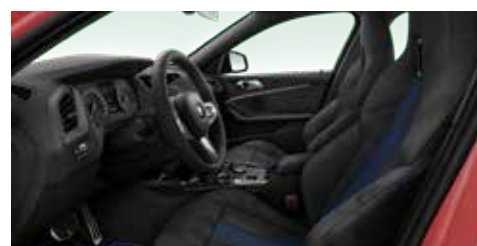
גימור פנים מואר Boston, חבילת M-Sport הכוללת: גלגל הגה M-Sport מצופה עור נאפה עם עיטור כרום, דיפון תקרה בד בגוון Anthracite, דוושות M בגימור אלומיניום, תיפור כחול על לוח השעונים, מושב M-Sport בריפוד בריפוד מושלם בד שחור וכחול, ספי כניסה M-Sport.