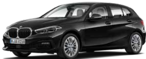
חישוקי סגסוגת "17 מדגם Multi-spoke style 547".