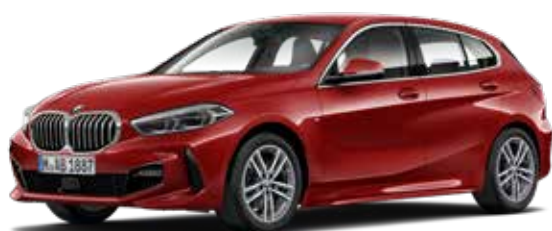
חישוקי סגסוגת "17 מדגם Double-spoke style 550 M Bicolour בשילוב גוון Jet-Black, פגושים וחצאיות ספורטיביים, מסגרות חלונות צד ומוטות גריל בגימור אלומיניום.