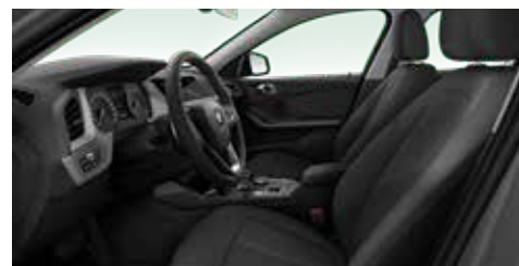
גלגל הגה Sport מצופה עור עם עיטור כרום, ריפוד בד שחור Grid, פנים בצבע Quartz Silver.