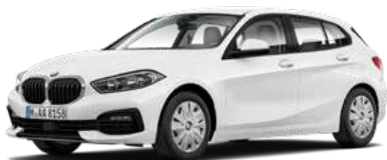
כיסויי נוי לחישוקי הגלגלים.