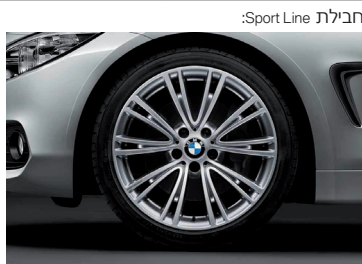
חישוקי סגסוגת קלה "19" דגם V-Spoke Style 626 Individual