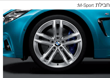
חישוקי סגסוגת קלה "19" דגם Double-Spoke style 704M