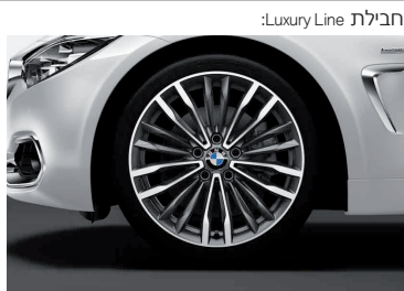
חישוקי סגסוגת קלה "19" דגם Multi-Spoke style 708