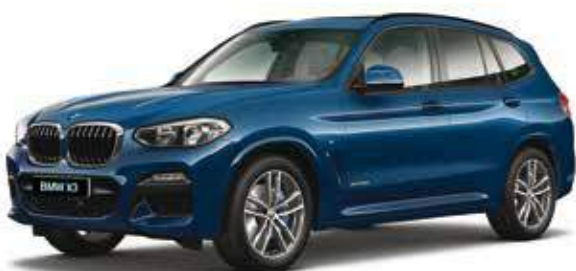
חבילת עיצוב M-Sport חישוקי סגסוגת 19" מדגם Double-spoke style 698 M, מסילות גג ומסגרת חלונות צד בגימור שחור מבריק (Individual Shadow line), פגושים וחצאיות צד M-aerodynamic.