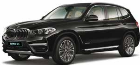
חבילת עיצוב Luxury Line חישוקי סגסוגת 19" מדגם Double-spoke style 696, מסילות גג בגימור אלומיניום, מסגרת חלונות צד ופריטי עיצוב חיצוניים בגימור כרום