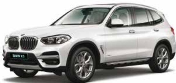
חבילת עיצוב xLine חישוקי סגסוגת 19" מדגם Y-spoke style 694, מסילות גג ומסגרת חלונות צד בגימור אלומיניום, פריטי עיצוב חיצוניים בגוון - Glacier silver