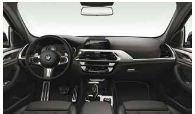
חבילת עיצוב M-Sport מושבי ספורט בריפוד בד משולב עור שחור עם תפרים כחולים, גלגל הגה M-sport, גימור פנים אלומיניום Rhombicle עם פס קישוט מבליט כרום, דושות M ייחודיות וחיפוי תקרה בגוון אפור Anthracite.