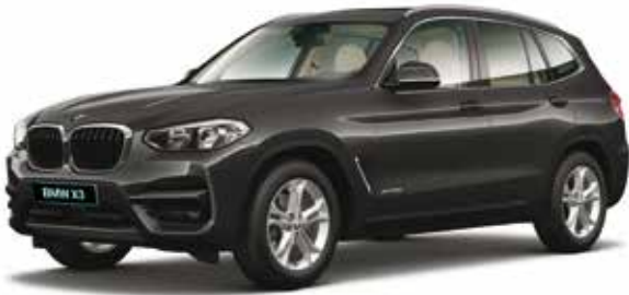
חישוקי סגסוגת "18 מדגם Double-spoke style 688, מסילות גג ומסגרת חלונות צד בגימור אלומיניום