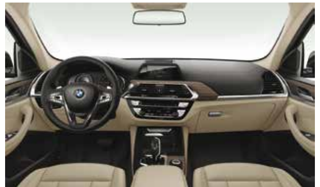
חבילת עיצוב Luxury Line ריפוד עור Vernasca במבחר צבעים לבחירה, גימור פנים עץ 'Fineline Cove' עם פס קישוט מבליט כרום, חיפוי Sensatec לחלקם העליון של הקונסולה המרכזית, לוח השעונים ודיפוני הדלתות.