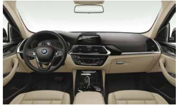
ריפוד Sensatec בגוון Canberra beige, גימור פנים שחור מבריק עם פס קישוט מבליט כרום