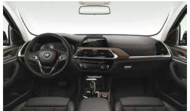
חבילת עיצוב xLine מושבי ספורט, ריפוד בד משולב עור בגווני אפור Anthracite ושחור, גימור פנים עץ 'Fineline Cove' עם פס קישוט מבליט כרום.