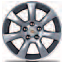
חישוקי 17" אלומיניום