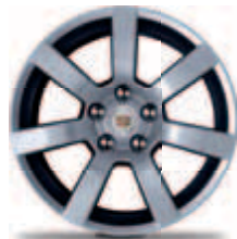
חישוקי 17" אלומיניום