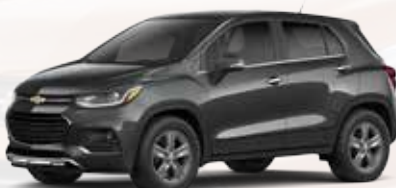
אפור כהה מטאלי (GK2)