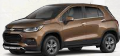
חום ליקר מטאלי (GD7)