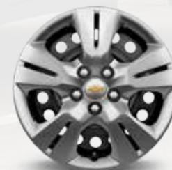
חישוקי פלדה עם חיפוי פלסטיק (LS)