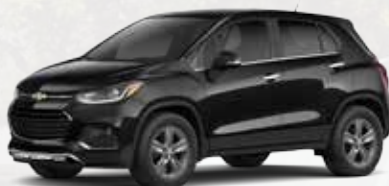
שחור מטאלי (GB0)