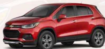
אדום בוקה (GG2)