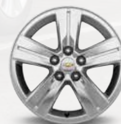
חישוקי אלומיניום (LT)