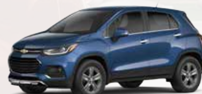
כחול בורקאי מטאלי (GQM)