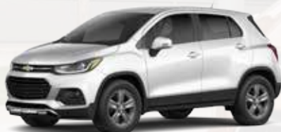
לבן מטאלי (GP5)