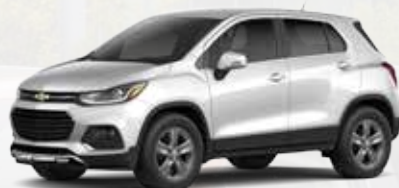
לבן פסגה (GAZ)