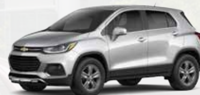
כסף מטאלי (GAN)