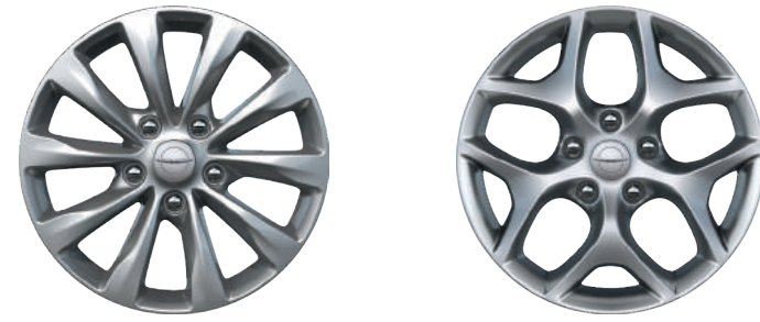
חישוקי 18 ברמת גימור limited חישוקי 17 ברמת גימור Touring L