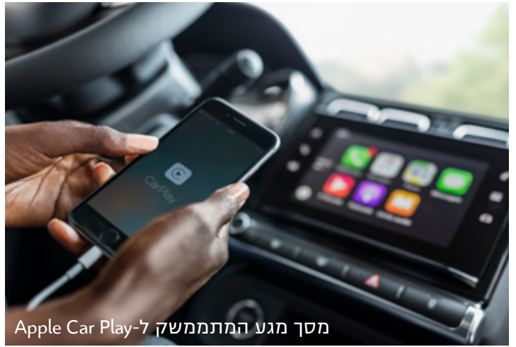
מסך מגע המתממשק ל-Apple Car Play