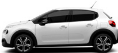
Polar White | WPP0 | לבן