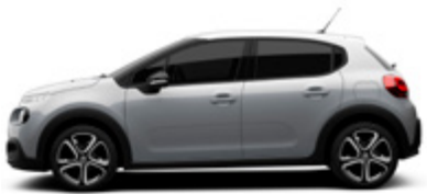
Arctic Steel | ZRM0 | כסף מטאלי