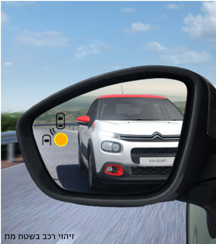
זיהוי רכב בשטח מת