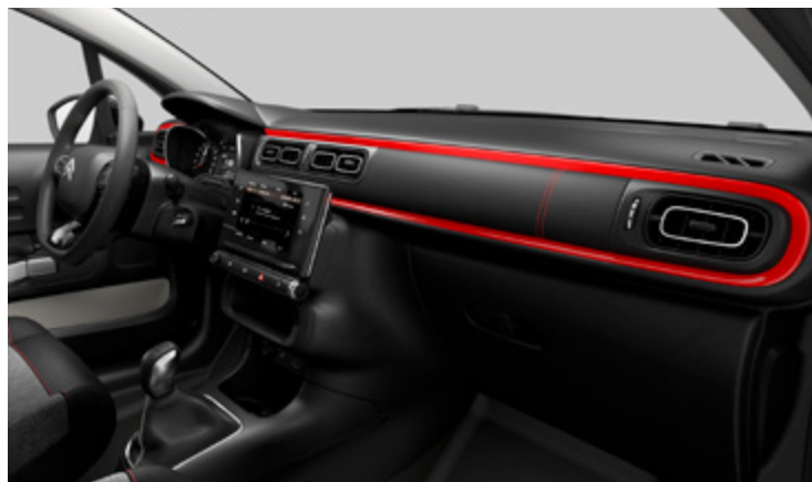
(בדגמי Shine PK בלבד) Urban Red