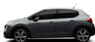
Shark Grey | 9PM0 | אפור כהה מטאלי