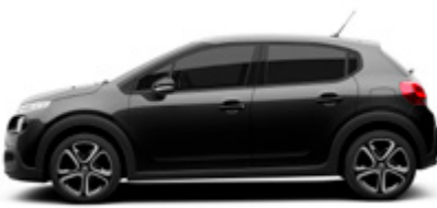
Perla Nera Black | 9VM0 | שחור פנינה