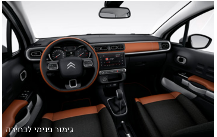
גימור פנימי לבחירה