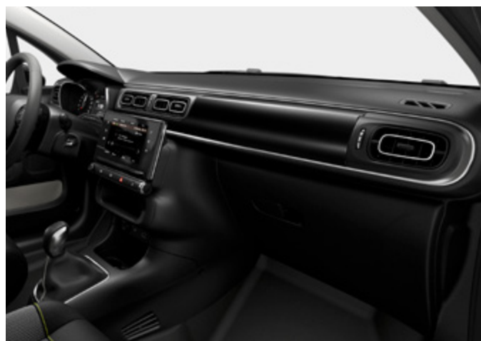
(בדגמי Feel) Standard Ambiance