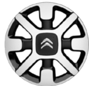
חישוק סגסוגת 17" (בדגמי Shine PK)