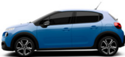
Cobalt blue | JYMO | כחול מטאלי