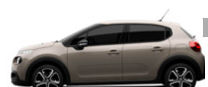
Soft Sand | EUM0 | בז' מטאלי