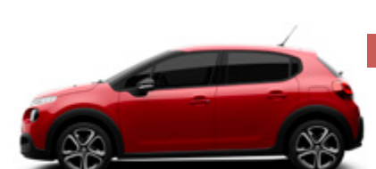
Ruby Red | PYMO | אדום מטאלי