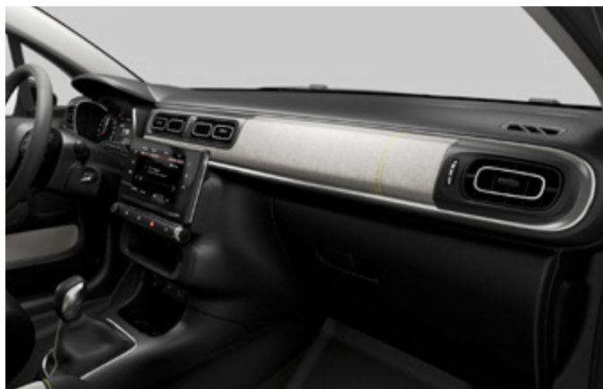
(בדגמי Shine PK בלבד) Metropolitan Grey