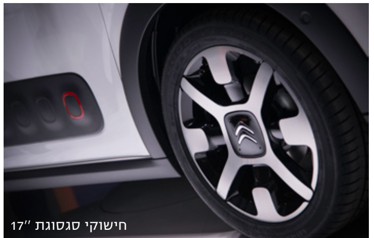
חישוקי סגסוגת 17"