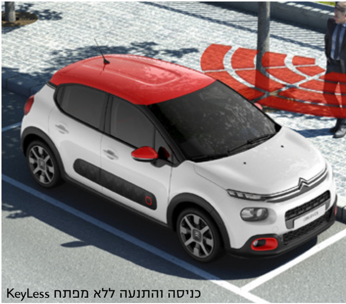
כניסה והתנעה ללא מפתח KeyLess