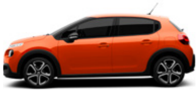
Orange Power | T4M0 | כתום מטאלי