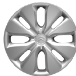
חישוקי פלדה 15" עם כיסוי פלסטיק בדגם ה- Feel