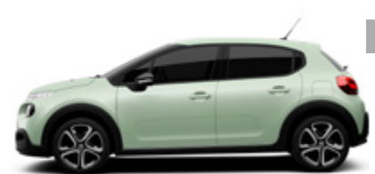
Almond Green | LSP0 | ירוק