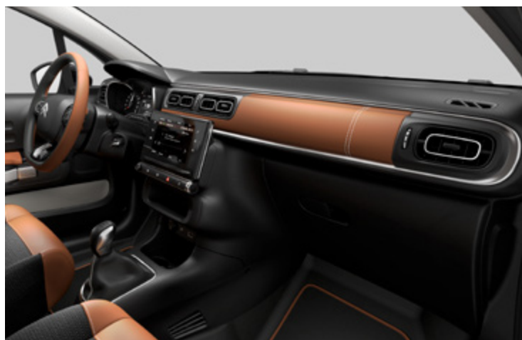
(בדגמי Shine PK בלבד) Hype Colorado