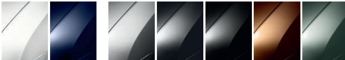
לבן קרח (369) כחול ניבי (D42) כסף מטאלי (D69) אפור מטאלי (KNA) שחור פנינה מטאלי (676) חום מטאלי (CNA) ירוק זית מטאלי (C67)