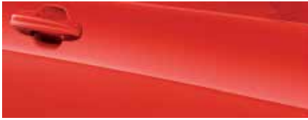
אדום מרוצים (FCZ)