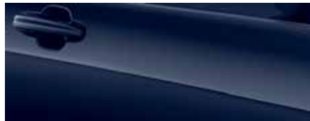
כחול בליזר (FCR)