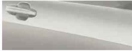
לבן קראמי מטאלי (FCL)