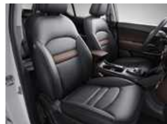
מושב עור, מושב נהג חשמלי, מושבים קדמיים מחוממים