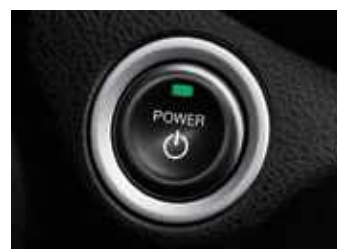
Keyless - כניסה והנעה ללא מפתח