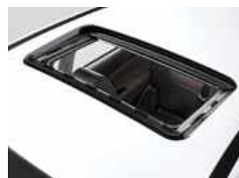
חלון שמש עם וילון אטימה מלאה