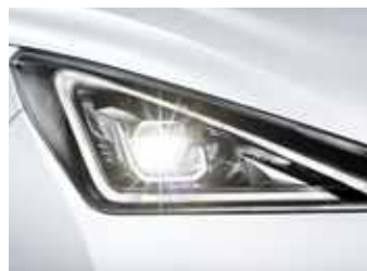
Full Led Technology הכוללת פונקציית Follow me home