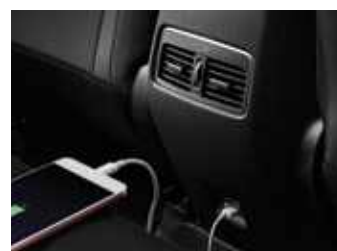
פתחי מיזוג מאחור כולל שקע USB