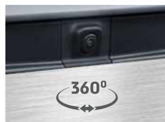
מצלמת 360 מעלות