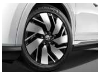
חישוקי סגסוגת קלה בקוטר 18"