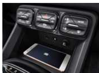
משטח טעינה אלחוטי להטלפון הנייד