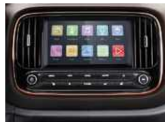
מסך מגע 8" בעברית הכולל: רדיו אינטרנטי, waze, פנגו, סלופארק