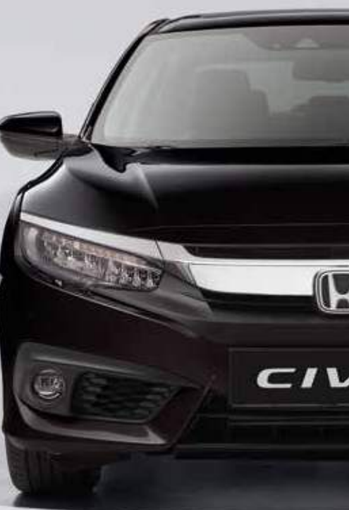
MIDNIGHT BURGUNDY PEARL