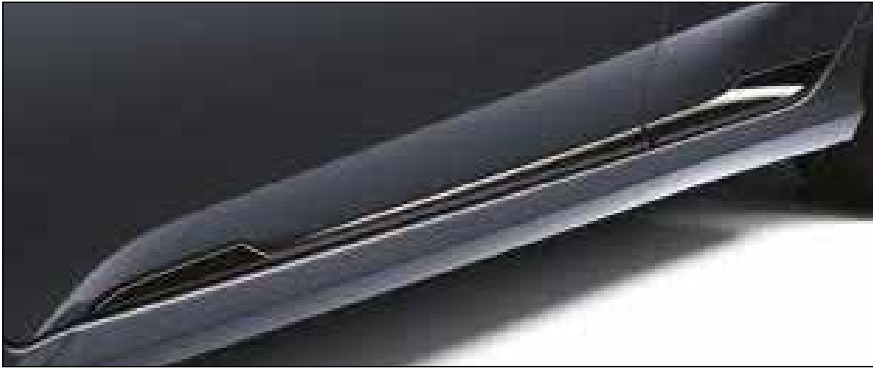
פס קישוט לדלת