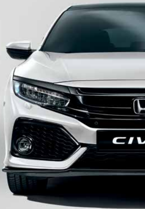
WHITE ORCHID PEARL