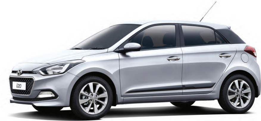
2015 פנואר ILMi20

דרגת זיהום אוויר מרכב מנועי** זיהום מירבי 1 2 3 4 5 6 7 8 9 10 11 12 13 14 15 זיהום מזערי * נתוני היצרן, ע"פ בדיקת מעבדה. תקן EC715/2007 ** הדרגה מחושבת לפי תקנות אוויר נקי (גילוי נתוני זיהום אוויר מרכב מנועי בפרסומת), התשס"ט 2009