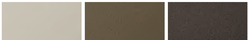
Y8Y בז' מטאלי