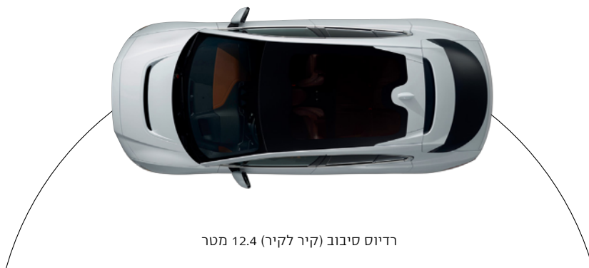
רדיוס סיבוב (קיר לקיר) 12.4 מטר