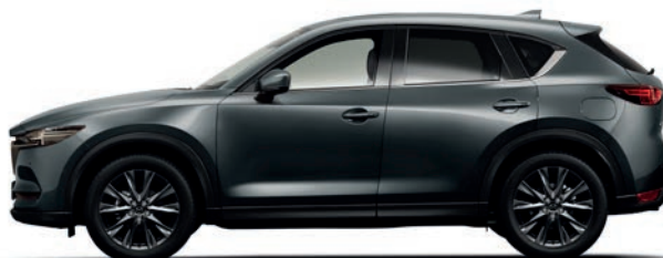
אפור עשיר (46G)*