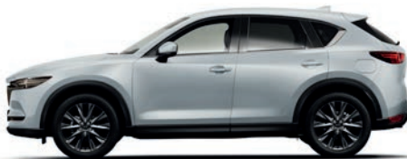
כסף סוניק (45P)