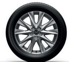
סגסוגת קלה 19" בגימור כסוף ברמות גימור Executive -1 Premium