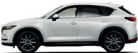
לבן פנינה (25D)