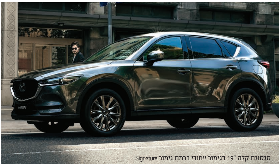
סגסוגת קלה 19" בגימור ייחודי ברמת גימור Signature