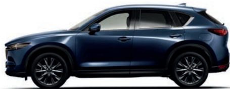
כחול קריסטל כהה (42M)