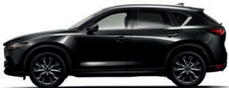
שחור סילון (41W)