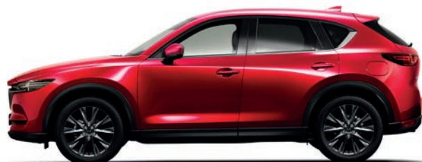
אדום עשיר נוצץ (46V)*