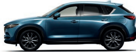
כחול נצחי (45B)