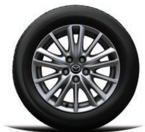
סגסוגת קלה 17" כסוף כהה ברמת גימור Comfort