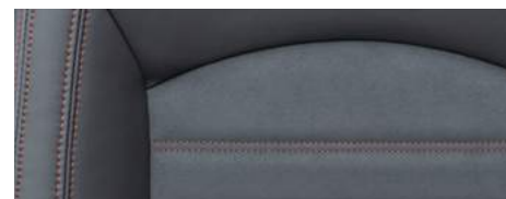
מושבי Grand Lux (R) עם תפרים אדומים*