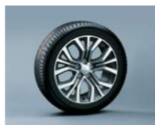
חישוקי סגסוגת 18"