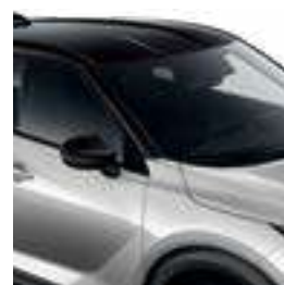
כסף מטאלי עם גג שחור XDR