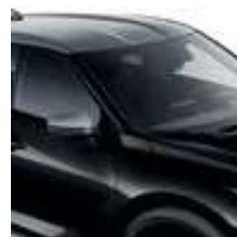
שחור מטאלי עם גג כסוף XDZ