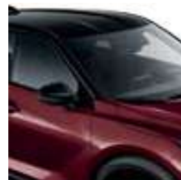
בורדו מטאלי עם גג שחור XDX