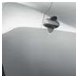
כסף מטאלי KYO