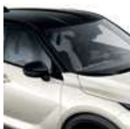
לבן פנינה מטאלי עם גג שחור XDF