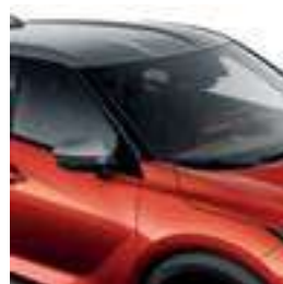
אדום שקיעה מטאלי עם גג כסוף XEZ