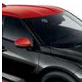
שחור מטאלי עם גג כתום XFC