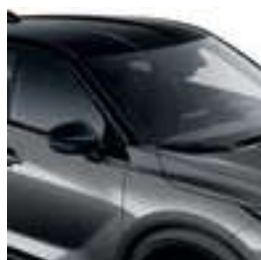
אפור מטאלי עם גג שחור XDJ