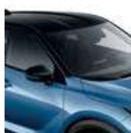
כחול קריביים מטאלי עם גג שחור XDY