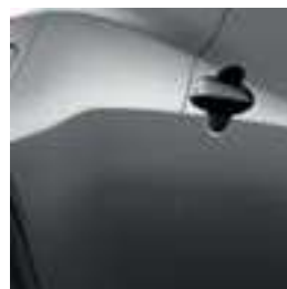
אפור מטאלי KAD