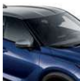
כחול כהה מטאלי עם גג כסף XEA