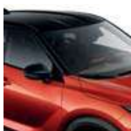
אדום שקיעה מטאלי עם גג שחור XEY