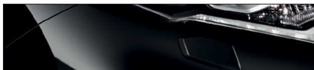
Z11 שחור מטאלי