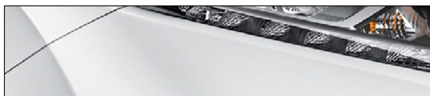
QAB לבן פנינה מטאלי