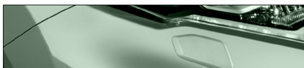
KBR אפור MINT