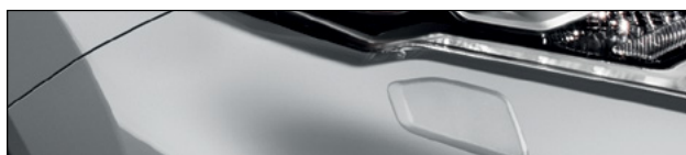
KYO כסף מטאלי