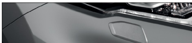
KAD אפור מטאלי