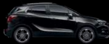
GBO - Minearal Black