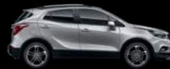
GAN - Sovereign Silver