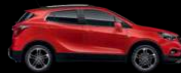
GG2 - Absolute Red