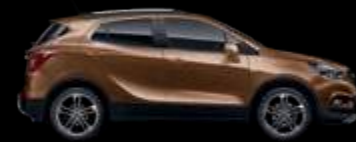
GD7 - Country Brown