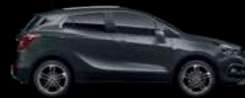
GK2 - Quantum Grey