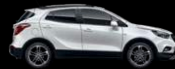
GAZ - Summit White