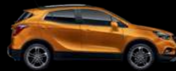
GL5 - Amber Orange