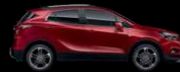
GCS - Velvet Red