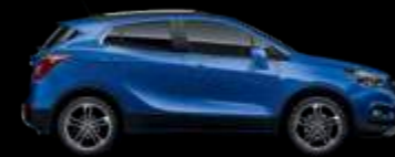
GQM - Borocay Blue