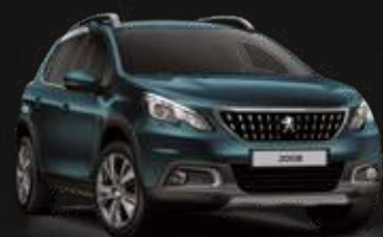
Emerald Crystal | DZM0 | כחול קריסטל מטאלי