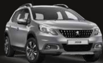
Artense Grey | F4M0 | אפור פלדה מטאלי