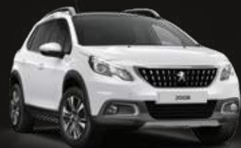
Banquise White | WPP0 | לבן