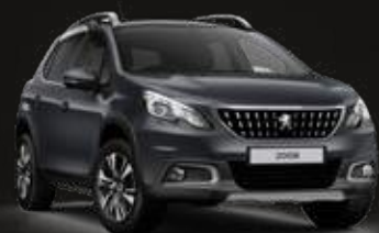
Hurricane Grey | 9GP0 | אפור כהה