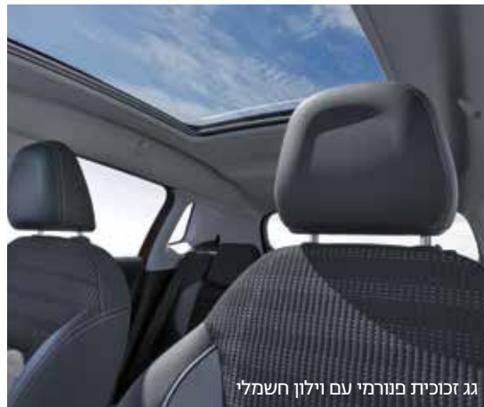
גג זכוכית פנורמי עם וילון חשמלי