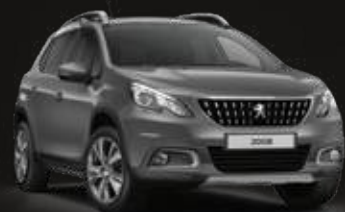
Platinum Grey | VLM0 | אפור כהה מטאלי