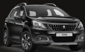
Perla Black | 9VM0 | שחור מטאלי