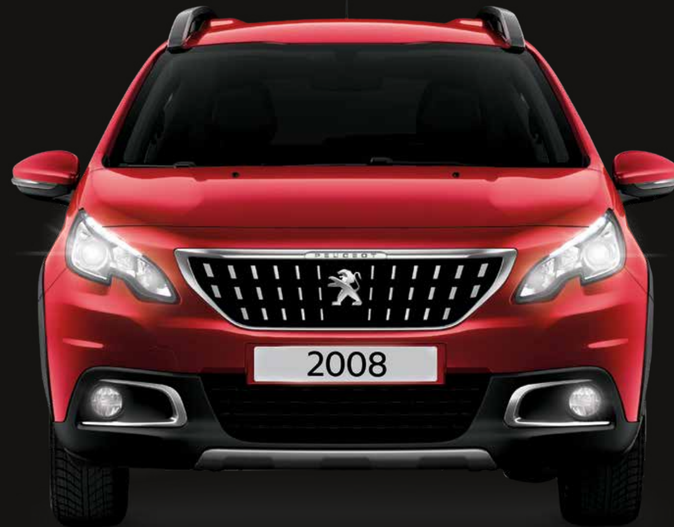
Ultimate Red | F3M5 | אדום מטאלי