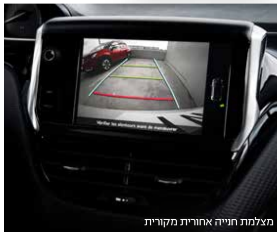
מצלמת חנייה אחורית מקורית