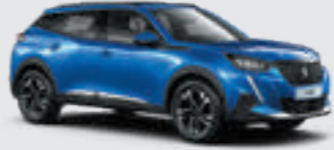
VERTIGO BLUE | SMM6 | כחול פנינה מטאלי