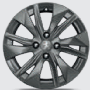
חישוקי סגסוגת 16" ELBORN בדגמי ACTIVE