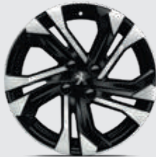
חישוקי סגסוגת 17" SALAMANCA בדגמי PREMIUM