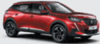
ELIXIR RED | VHM5 | אדום מטאלי