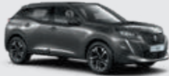
PLATINIUM GREY | VLM0 | אפור כהה מטאלי