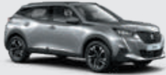
ARTENSE GREY | F4M0 | כסוף כהה מטאלי