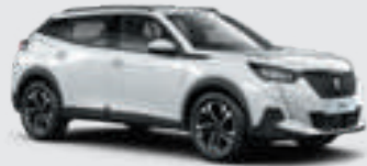
BANQUISE | WPP0 | לבן בנקיז

לרשותך עומד מגוון רחב של צבעים שיאפשר לך להביע את עצמך באופן מלא.