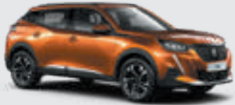
ORANGE FUSION | 2SM0 | כתום מטאלי