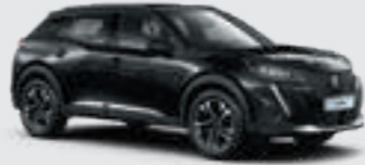
ONYX BLACK | XYPO | שחור מטאלי