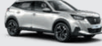
PEARLESCENT WHITE | N9M6 | לבן פנינה מטאלי