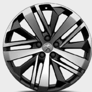
חישוקי סגסוגת 19" BOSTON שני גוונים במארג יהלום סטנדרט לדגמי GT