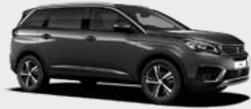
Gris Platinum | VLM0 | אפור פלטיניום מטאלי