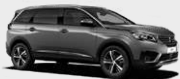
Gris Cumulus | F4M0 | אפור פלדה מטאלי