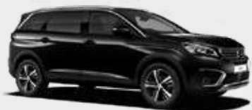
Noir Perla | 9VM0 | שחור מטאלי