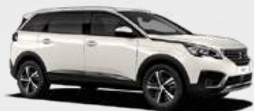
Noir Nacré | M6N9 | לבן פנינה