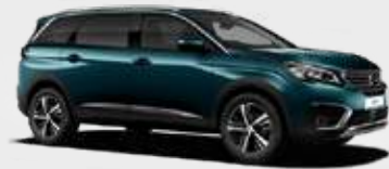
Emerald Crystal | DZM0 | כחול קריסטל מטאלי