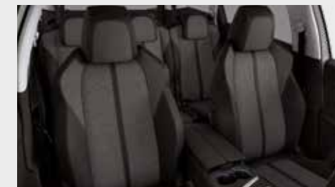
ריפוד פנימי וגימור דלתות בצבע אפור כהה