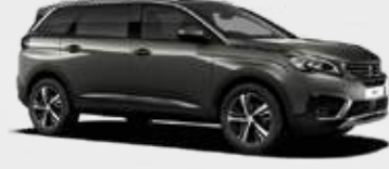
Gris Amazonite | KLM0 | ירוק אמזון מטאלי