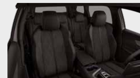
מושבים בריפוד עור מלאכותי משולב אלקנטרה