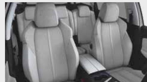
ריפוד פנימי וגימור דלתות בצבע אפור בהיר