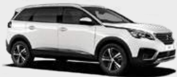
Blanc Banquise | WPP0 | לבן קרחון