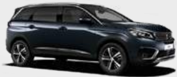
Bourasque | T4M0 | כחול כהה מטאלי