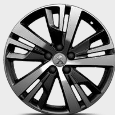
חישוקי סגסוגת 18" DETROIT שני גוונים במארג יהלום סטנדרט לדגמי PREMIUM-1 ACTIVE