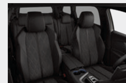
ריפוד פנימי וגימור דלתות בצבע אפור כהה