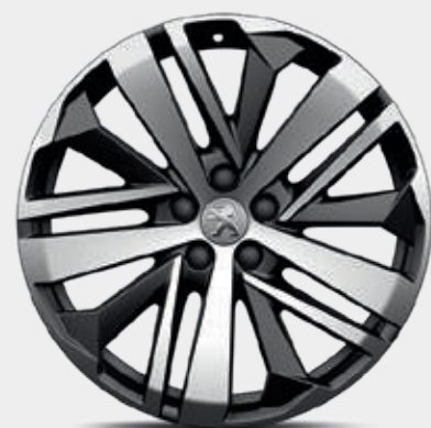
חישוקי סגסוגת 19" WASHINGTON שני גוונים במארג יהלום סטנדרט לדגמי GT