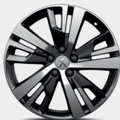
חישוקי סגסוגת 18" DETROIT שני גוונים במארג יהלום סטנדרט לדגמי ACTIVE ו-PREMIUM