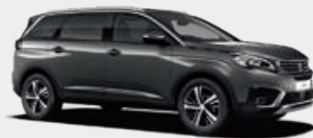
Platinum Grey | VLM0 | אפור כהה מטאלי |