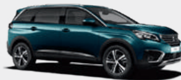
Emerald Crystal | DZM0 | כחול טורקיז מטאלי |