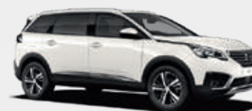
Pearl White | N9M6 | לבן פנינה |