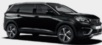
Perla Nera Black | 9VM0 | שחור מטאלי |