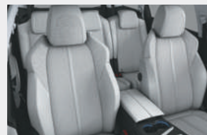
ריפוד פנימי וגימור דלתות בצבע אפור בהיר