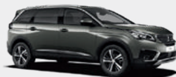
Amazonite Grey | KLM0 | אפור ירקרק מטאלי |