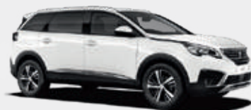
Banquise White | WPP0 | לבן קרחון |