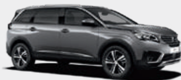
Artense Grey | F4M0 | כסוף כהה מטאלי |