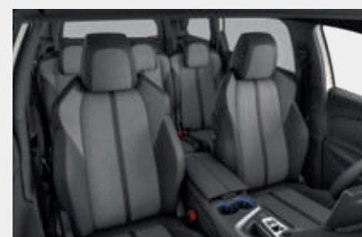
ריפוד פנימי וגימור דלתות בצבע אפור כהה