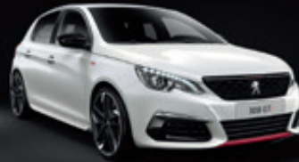
Blance Nacre | N9M6 | לבן פנינה