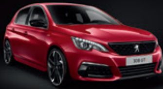
Rouge Ultimate | F3M5 | אדום