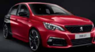
Coupe Franche | D369 & F3M5 | אדום & שחור