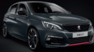
Gris Hurricane | 9GP0 | אפור כהה