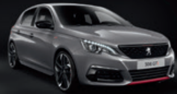
Gris Artense | F4M0 | אפור פלדה