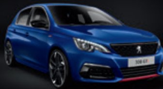
Blue Magnetic | EGM0 | כחול