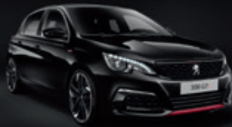
Noir Perla | 9VM0 | שחור