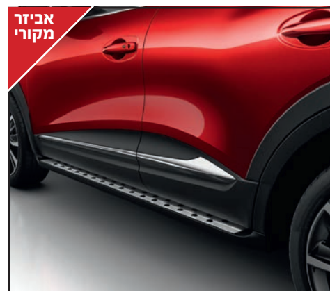
זוג מדרכי סף דלת קדמיים עם כיתוב Renault LP00013710