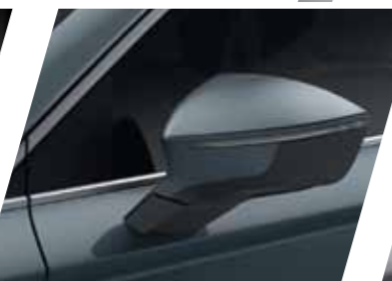
אפור F6 S