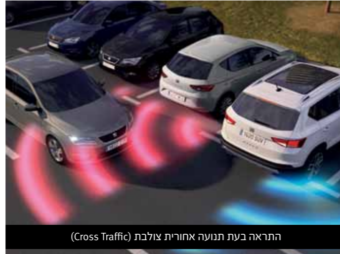
התראה בעת תנועה אחורית צולבת (Cross Traffic)