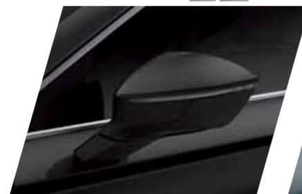
שחור 1Z S / XC