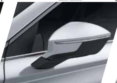
לבן נבאדה 2Y S / XC