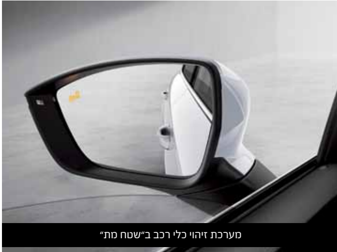
מערכת זיהוי כלי רכב ב"שטח מת"