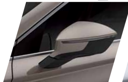
קפה 4K S