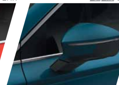
כחול 0F S / XC