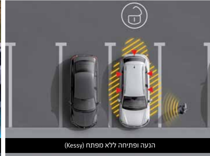
הנעה ופתיחה ללא מפתח (Kessy)