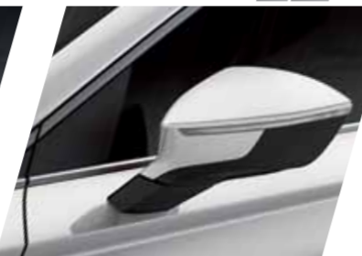
לבן 9P S / XC