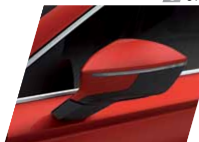
אדום 8T S