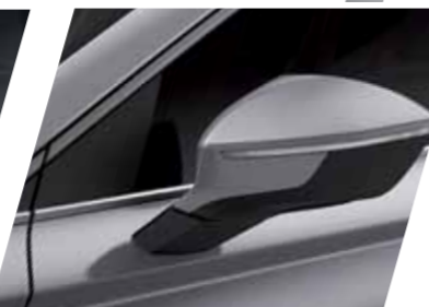
כסף 8E S