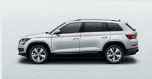
Moon White 2Y