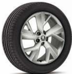
רמת גימור Exclusive 19"