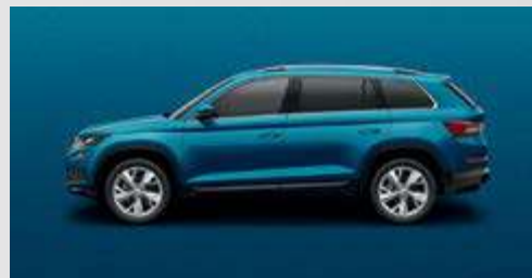
Lava Blue OF