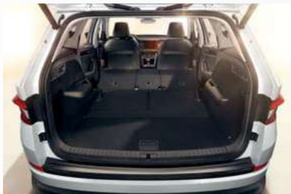
תא מטען מחוץ