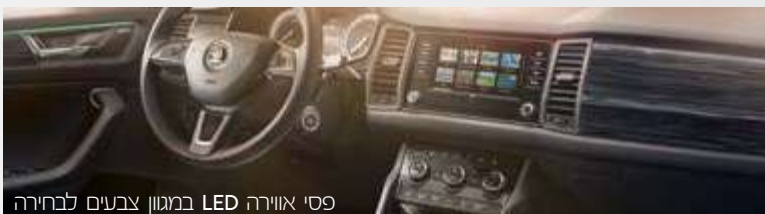
פסי אווירה LED במגוון צבעים לבחירה