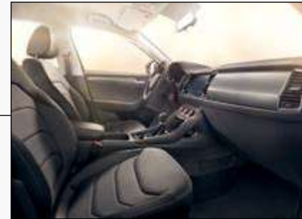
ריפוד בד - שחור