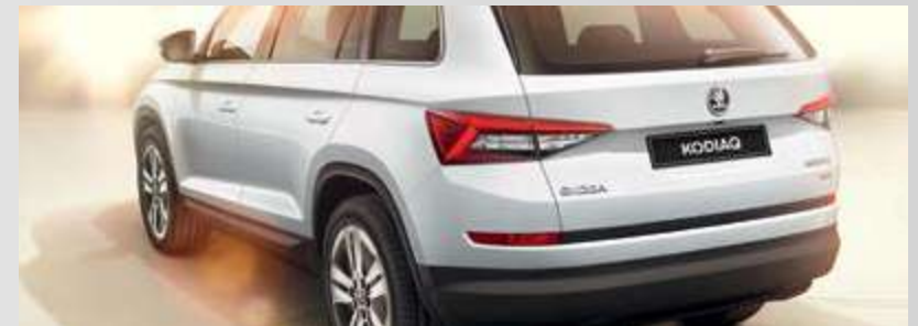
פס כוורת אחורי - מוטיב עיצובי ופונקציונאלי שמטרתו להגן על הפגוש בעת הטענת ציוד