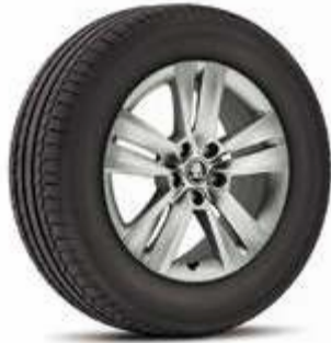
רמת גימור Ambition 17"