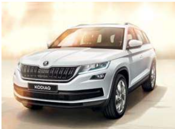
פנסי חזית מסוג FULL LED