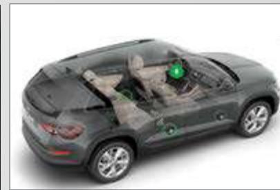
תא אחסון לנהג מתחת להגה לנגישות גבוהה