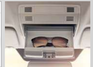
תא אחסון למשקפיים