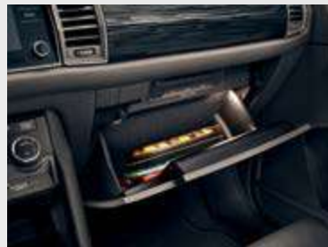
תא אחסון תחתון מקורר