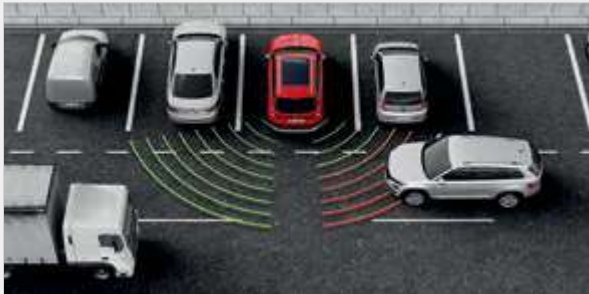
מערכת אקטיבית Rear traffic alert

ה-Skoda KodiaQ מוק ונסן להתמודד בתנאים הקשוחים ביותר כאשר הוא מקרין כח מלכותי. הקיים המדויקים חדים, מעוצבים בשפת העיצוב החדשה של Skoda לסגמנט ה-SUV ועושה אותו ייחודי, מעורר רגש ועומד במבחן הזמן. בין אם נמדד בפרטים או באופן כללי, בהר כי קיימת הרמוניה בין העיצוב והצורה לפונקציונליות. ה-KodiaQ בעל יופי שרירי המשלב גוף קשיח עם איכויות שטח.