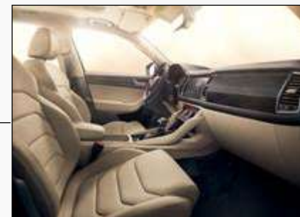
ריפודי עור לבחירה - שנהב