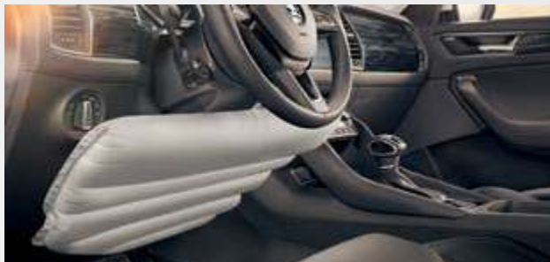
כרית אוויר לברך הנהג