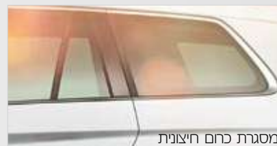
מסגרת כרום חיצונית