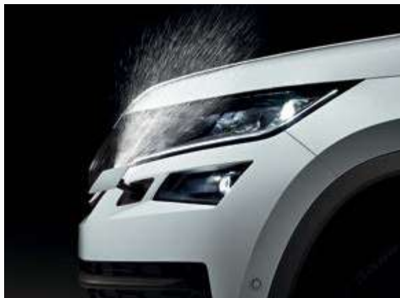
מערכת מתזים טלסקופית לפנסי חזית