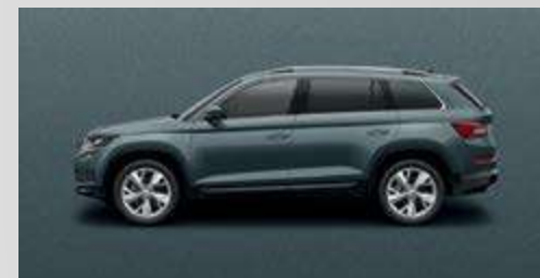
Quartz Grey F6