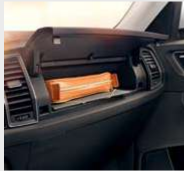
תא אחסון עליון