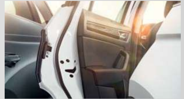
הגנת פתיחת דלתות ממכניות/מקירת