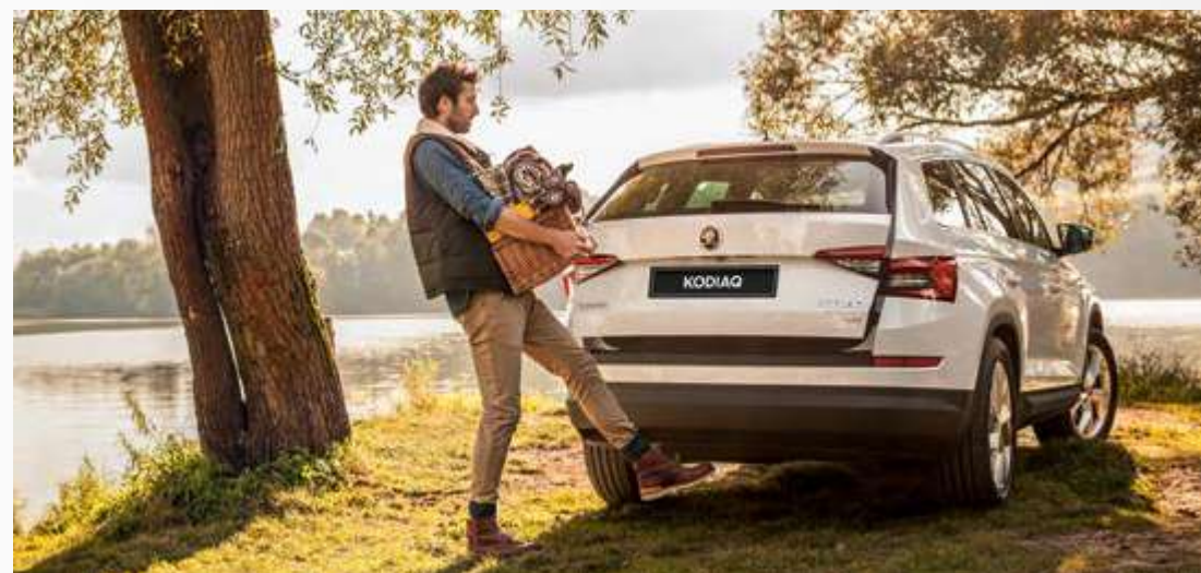
דוושה וירטואלית לנוחות מלאה