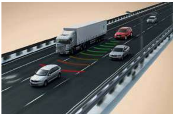
בקרת שיט אדפטיבית