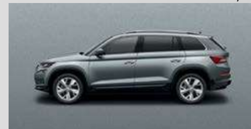
Business Grey 2C