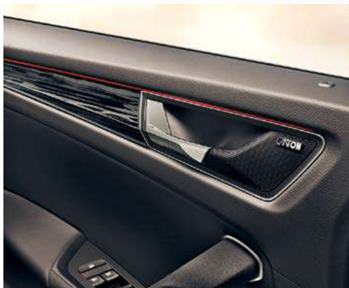
מערכת שמע Canton