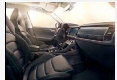
ריפודי עור לבחירה - שחור