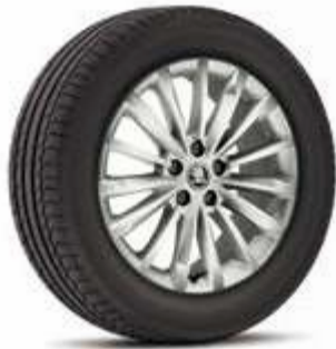
רמת גימור Style 18"