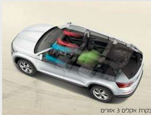
בקרת אקלים 3 אזורים