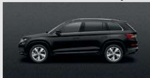
Magic Black 1Z