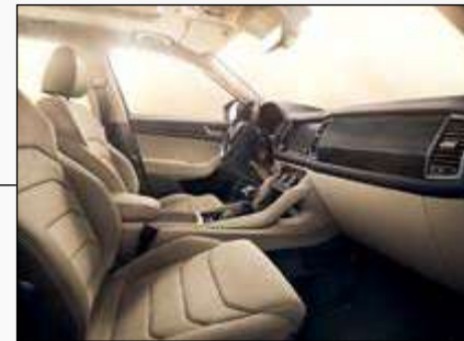
ריפודי אלקנטרה לבחירה - שנהב