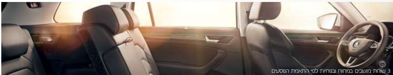
3 שורות מושבים במחוח ובנוחיות לפי הרגמת הנסעים