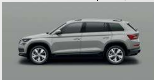
Steel Grey Uni M3 (לא מטאלי)