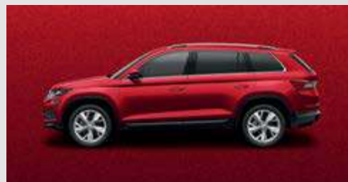
Velvet Red K1 (בתוספת תשלום)