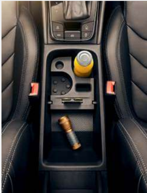
משענת יד קדמית עם אחסון. מחזיקי כוסות/בקבוקים לפתיחה ביד אחת