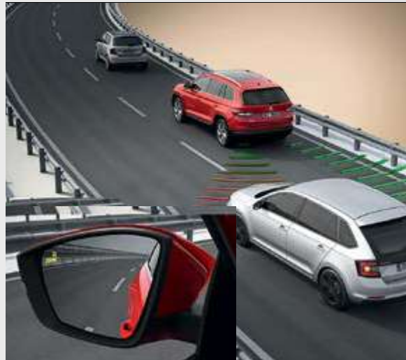
מערכת לזיהוי כלי רכב בשטח מת