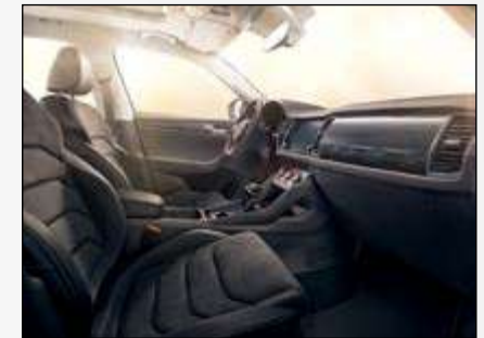
ריפודי אלקנטרה לבחירה - שחור