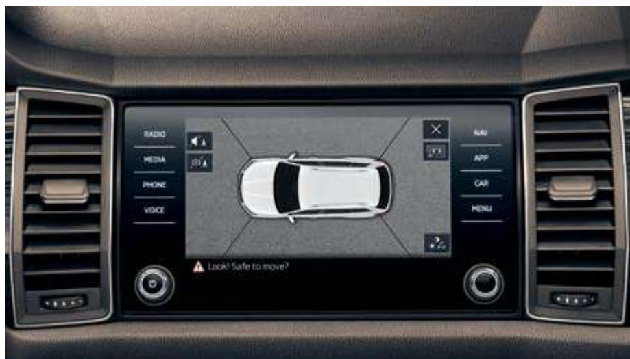
מצלמה 360° היקפית המאפשרת לראות את הרכב ע"ג מערכת השמע ממבט מעוף ציפור