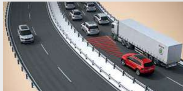
מערכת Front Assist (ניטור מרחק מלפנים)