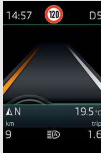
מערכת אקטיבית למניעת סטייה מנתיב