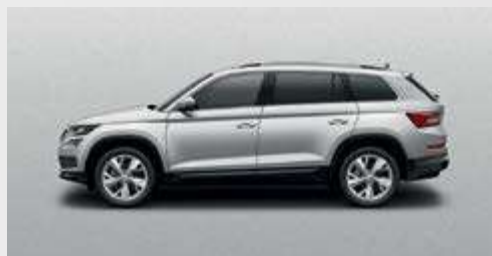
Brilliant Silver 8E