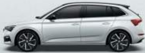
MOON WHITE METALLIC