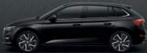
MAGIC BLACK METALLIC