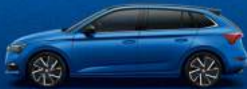
RACE BLUE METALLIC