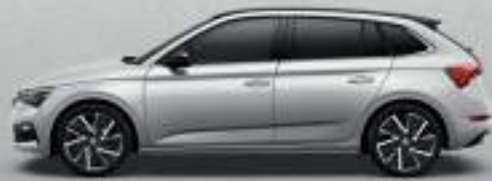
BRILLIANT SILVER METALLIC