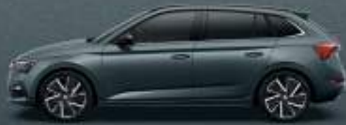
QUARTZ GREY METALLIC