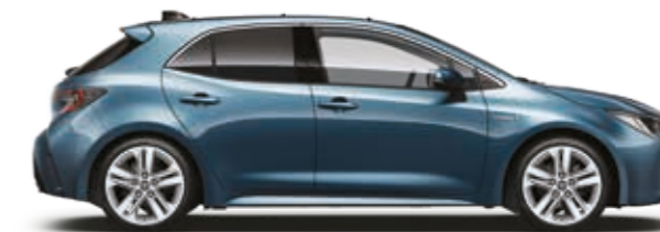
כחול מטאלי 8U6