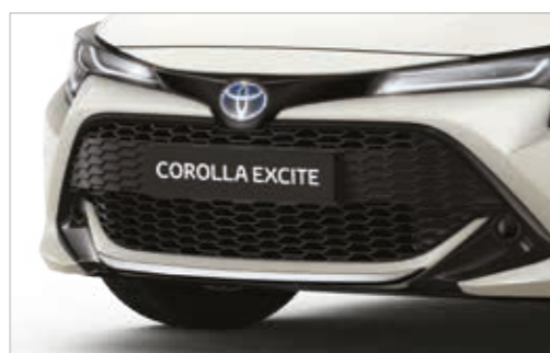
מגן פגוש קדמי בצבע שחור