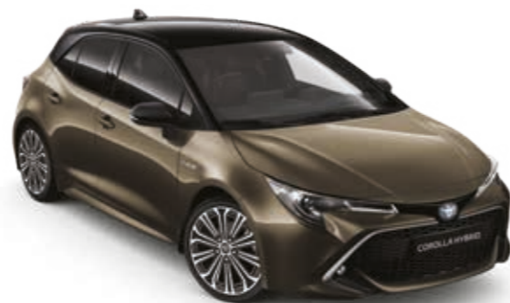
ברונזה מזהב/שחור 2RF