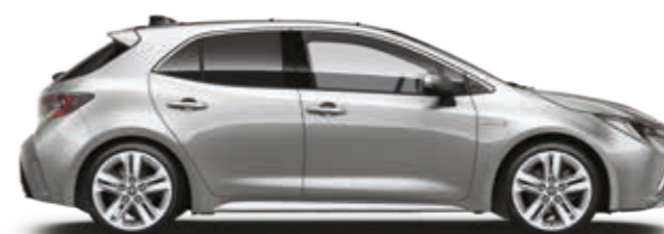
כסף מטאלי 1F7