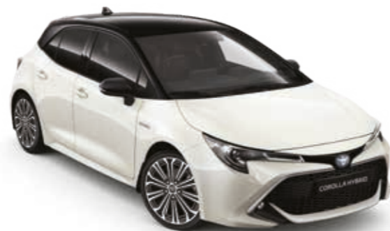
לבן פנינה/שחור 2KR