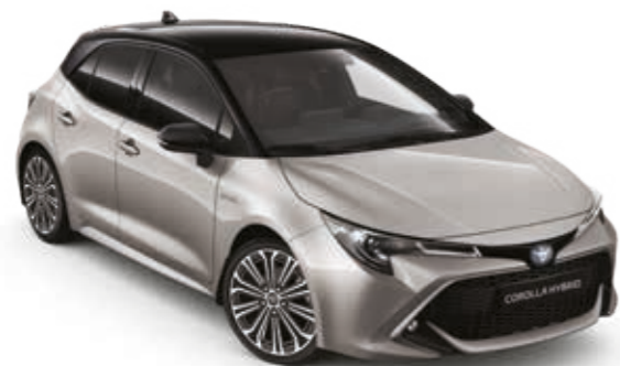
כסף יוקרתי/שחור 2RD