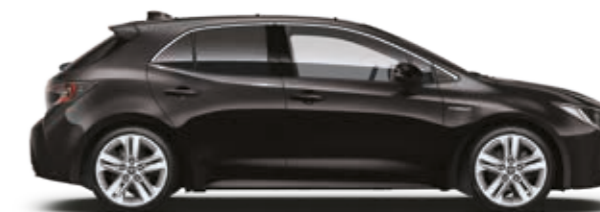
שחור נואר מטאלי 209