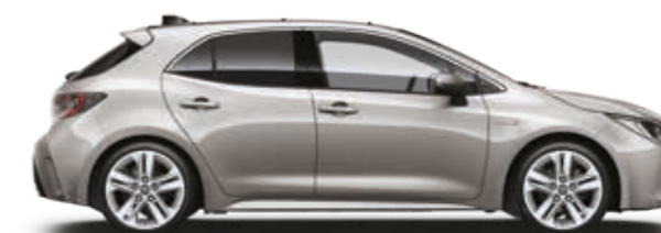
כסף יוקרתי מטאלי 1J6