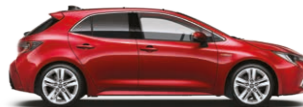
אדום עז 3U5