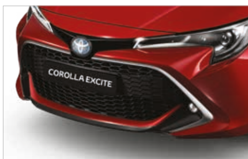
קישוט פגוש קדמי בצבע כרום