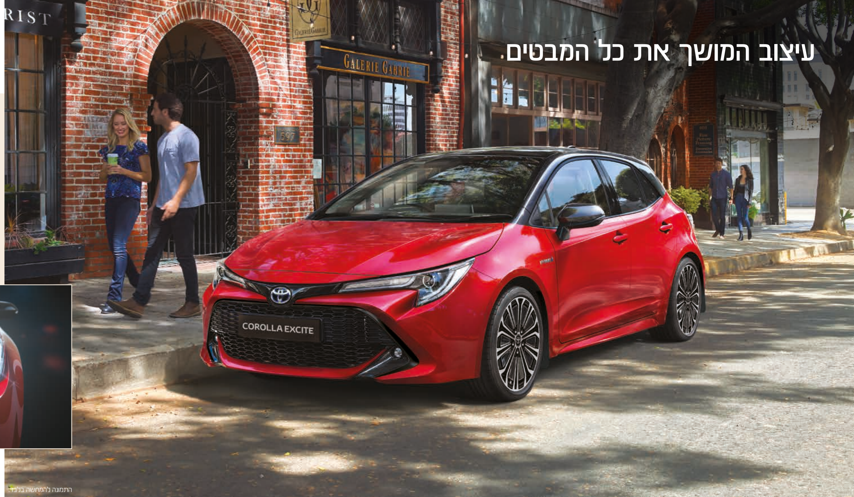
התמונה להמחשה בלבד.