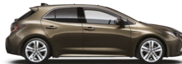
ברונזה מזהב מטאלי 6X1