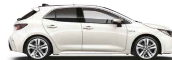
לבן פנינה מטאלי 070