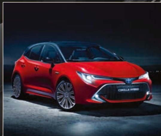
כיבוי תאורה מושהה Follow Me Home