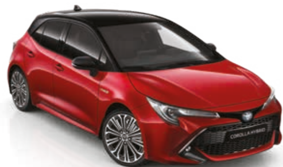
אדום עז/שחור 2SZ