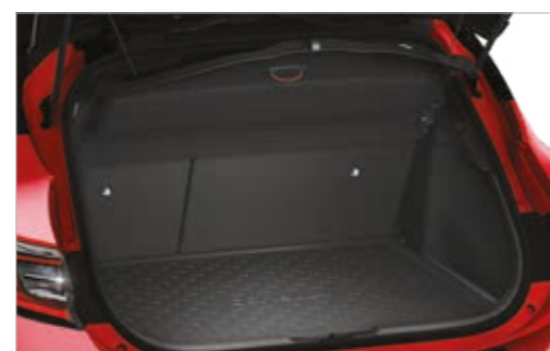
אמבטיה לתא מטען