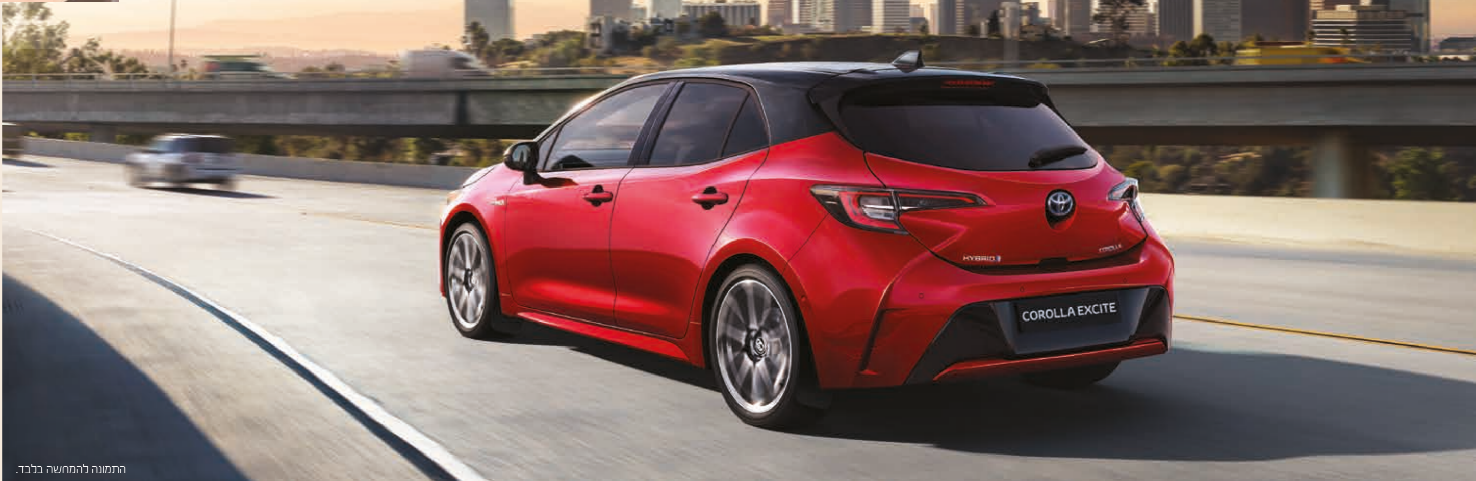
התמונה להמחשה בלבד.

טכנולוגיית Hybrid Synergy Drive® מעניקה ביצועים יוצאי דופן ללא פשרות ונתוני צריכת דלק מרשימים.