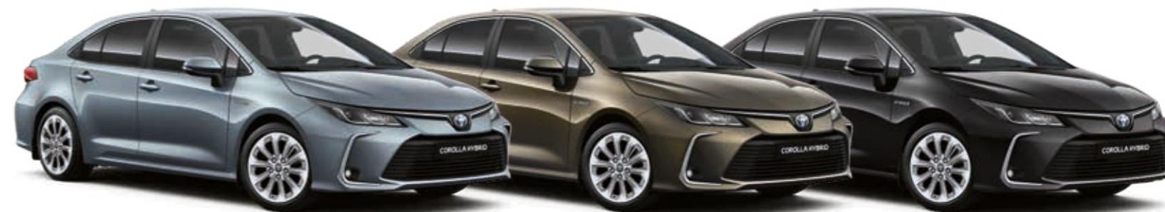
אפור תכלת מטאלי 1K3