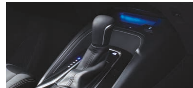
משטח טעינה אלחוטית לטלפון נייד*