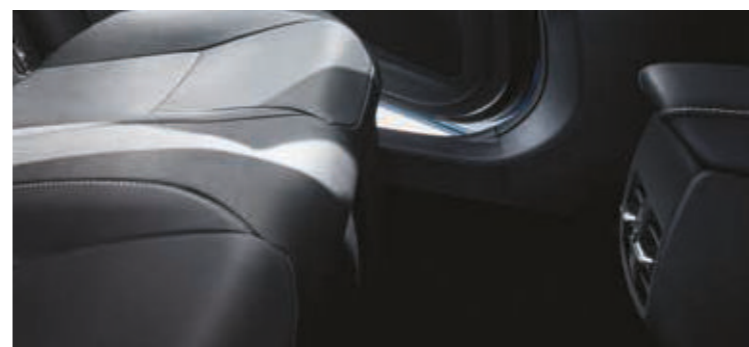
פתחי מיזוג אחוריים ליושבים במושב האחורי