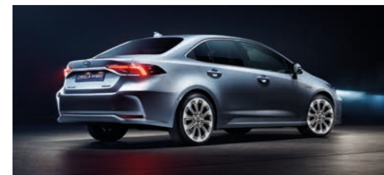
כיבוי תאורה מושהה FOLLOW ME HOME