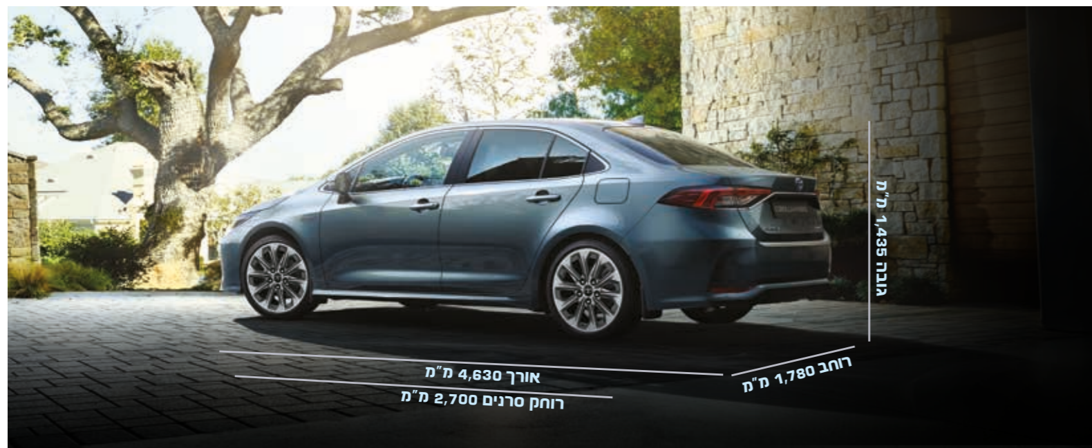
התמונה להמחשה בלבד.