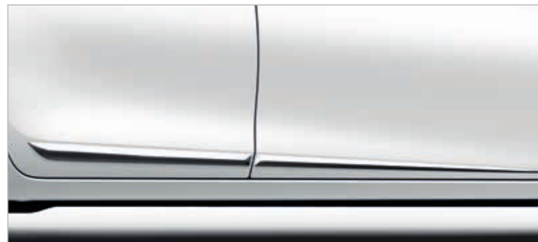
סט פסי קישוט ניקל לדלתות