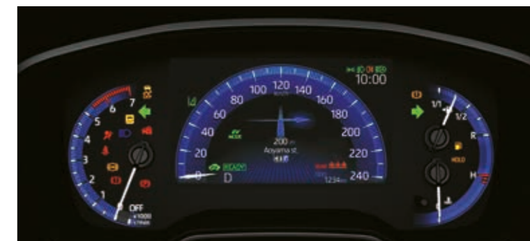
מסך נתונים 7" צבעוני בלוח המחוונים*

*זמין בחלק מרמות הגימור. התמונות להמחשה בלבד