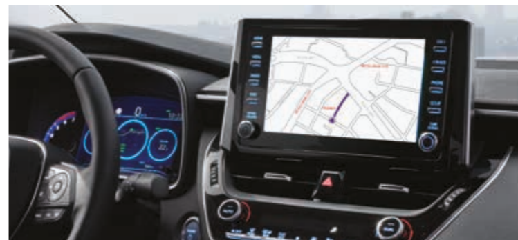
מערכת מולטימדיה 9" דוברת עברית הכוללת ניווט WAZE