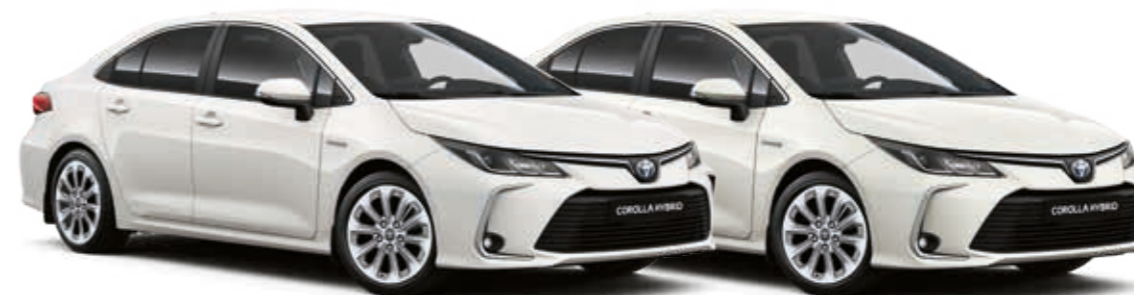
לבן פנינה מטאלי 0S0