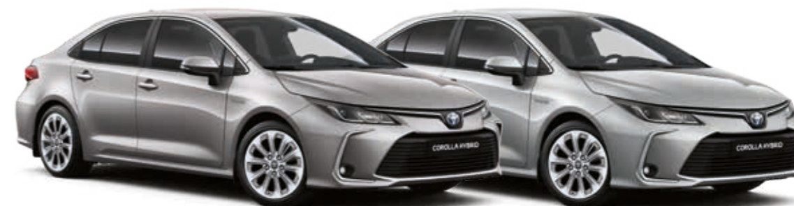
אפור מתכתי מטאלי 1K0