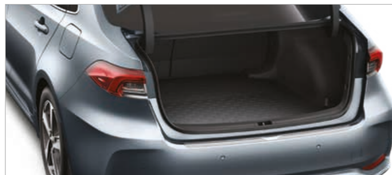
אמבטיה לתא מטען