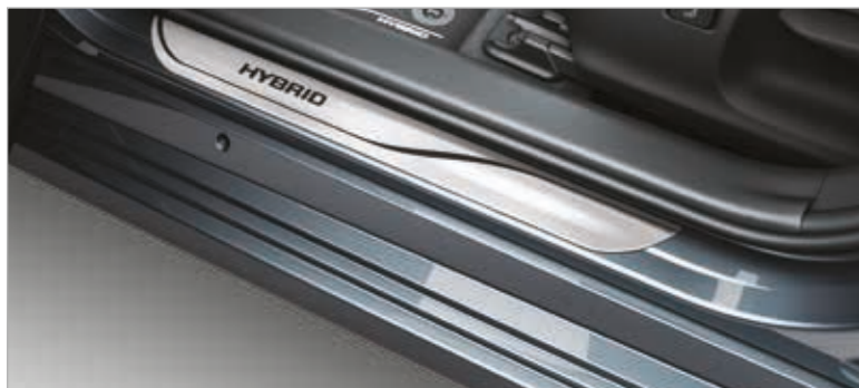
קישוט סף דלת מאלומיניום