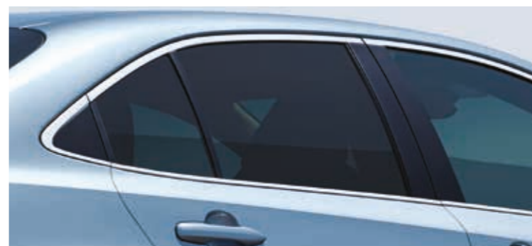
שמשות אחוריות כהות*